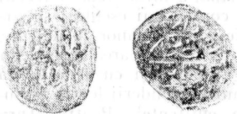
Fig. 1. Dirhem de la Murad al III-lea bătut la Canca, descoperit la Buftea, Sectorul Agricol Ilfov.

E. Nicolae, G. Custurea, Buletinul Societății numismatice române , 77—79 1983—1985, p. 311, tip Af, cu numele atelierului scris ușor diferit.