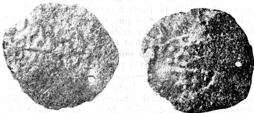
Fig. 2. Dirhem otoman fals descoperit la Radu Vodă București (2/1)

Piesa face parte din categoria falsurilor cu legenda „barbarizată” (în mod evident pe revers) și parțial „în oglindă”, ceea ce ar putea indica realizarea ei în părțile europene ale Imperiului Otoman. Prototipul îl reprezintă emisiunile bătute la Canca sub Murad al III-lea, fapt asigurat în primul rînd de cartușul folo-