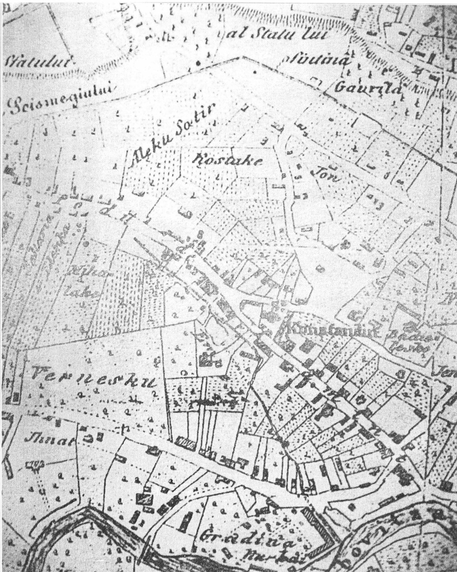
Figura 1. Planul Boroczyn, 1852.