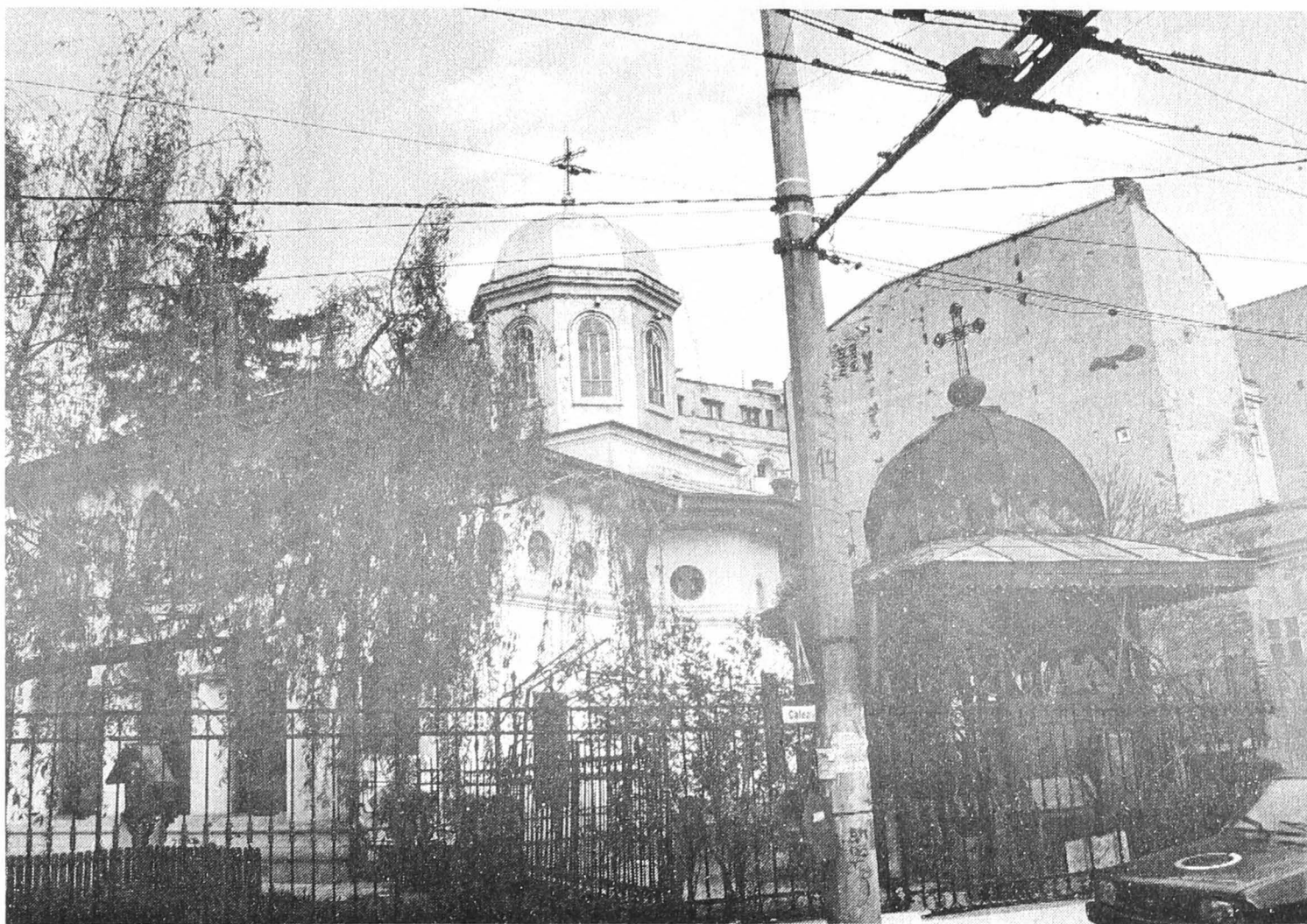
Figura 5. Fațada dinspre Calea Plevnei.