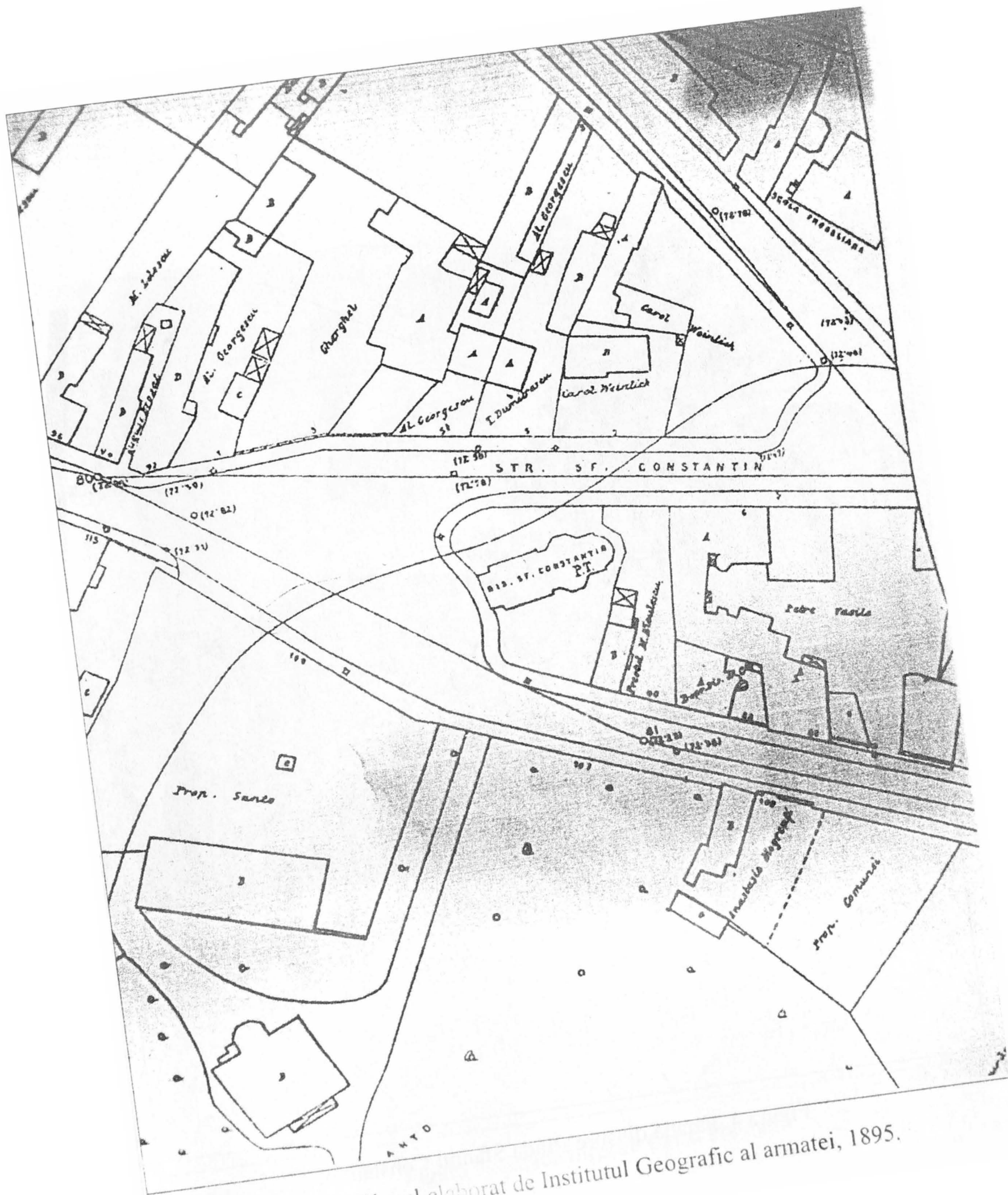
Figura 3. Planul elaborat de Institutul Geografic al armatei, 1895.