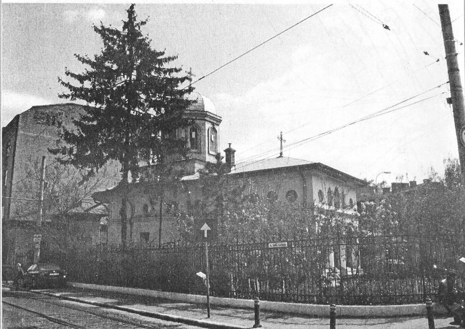
Figura 4. Fațada dinspre strada Sfântul Constantin.