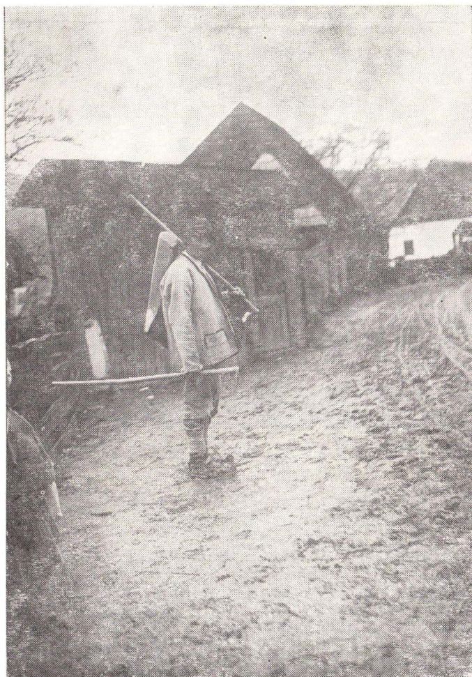
Fig. 3. Spălător de aur din Sălciua — Valea Arieșului —.

aceasta se punea numai nisip mărunț (boazgă“) și un prundiș mai mare. Peste nisip se toarnă apoi cu căucă, „dîrguim“ mereu („dîrg“ un fel de greblă, cu care se trage materialul) pînă se gată din huncă. Nisipul rămas după alegerea în șaitroc se numea „rom“ sau „roame“ (un fel de deșeuri). Aurul pur se strîngea într-un corn de vită numit „tulnic“ sau și „țirău“, la urmă se ropea într-un „bliduț“, apoi se vindea la gozari (speculanți), sau se preda statului.