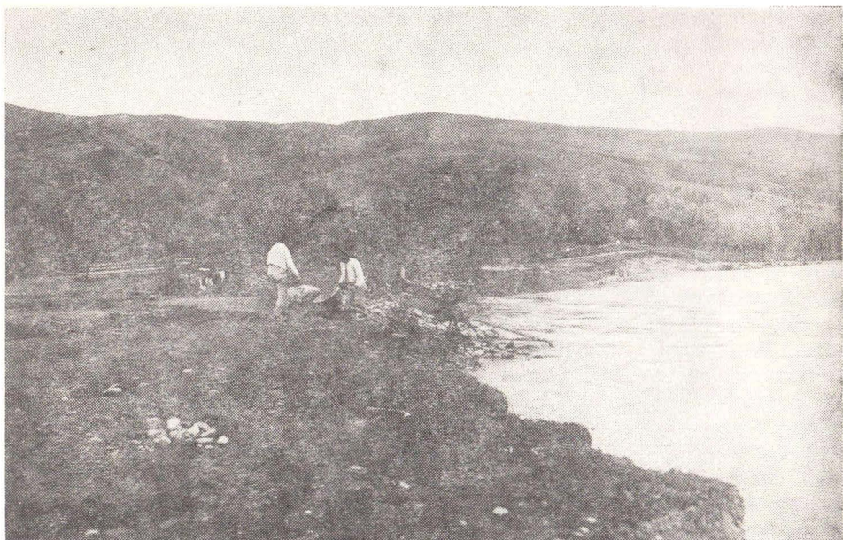
Fig. 4. Spălători de aur cu „hurca” din Lupșa. Valea Arieșului.