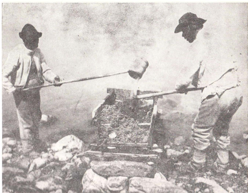
Fig. 5. Spălători de aur din Lupșa, Valea Arieșului.