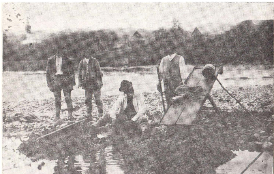
Fig. 7. „pănurilor“ în „copaie“ Lupșa, Valea Arieșului.