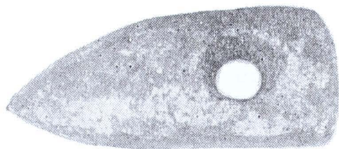
Fig. 2 — Ady Endre . Topor de piatră.

II. Ady Endre (comuna Căuaș, jud. Satu Mare). În hotarul estic al satului, săpîndu-se un canal de irigație, s-au scos la lumină resturi arheologice (urme de locuințe, fragmente ceramice și unelte litice) caracteristice epocii bronzului timpuriu. Dintre piesele salvate de Gr. Blăjan amintim cîteva fragmente ceramice atipice și un topor-ciocan de piatră șlefuită lucrat din granit bazaltic verde-gri (fig. 2). Unealta, cu secțiunea transversală plan-convexă și rectangular-trapezoidală în secțiune longitudinală, are orificiul de înmănușare deplasat spre muchie Brațul-ciocan, lung de 2,2 cm, se distinge printr-o muchie plată, prezentînd urme dese de lovire în urma întrebunțării în-