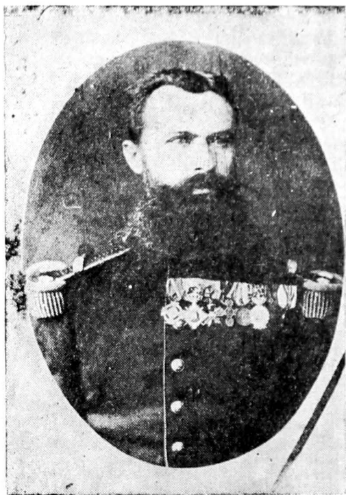
Fig. 4. Moise Grozea (după războiul de independență).

6 scrisori sînt inedite, iar 15 au fost publicate parțial în anii 1877—1878 în paginile Gazetei Transilvaniei , la rubrica De pe campulu de resbelu (Correspondenție speciale ale Gaz. Transilvaniei).