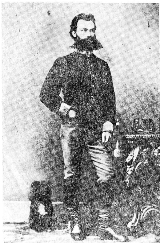
Fig. 1. Moise Grozea în 1873.