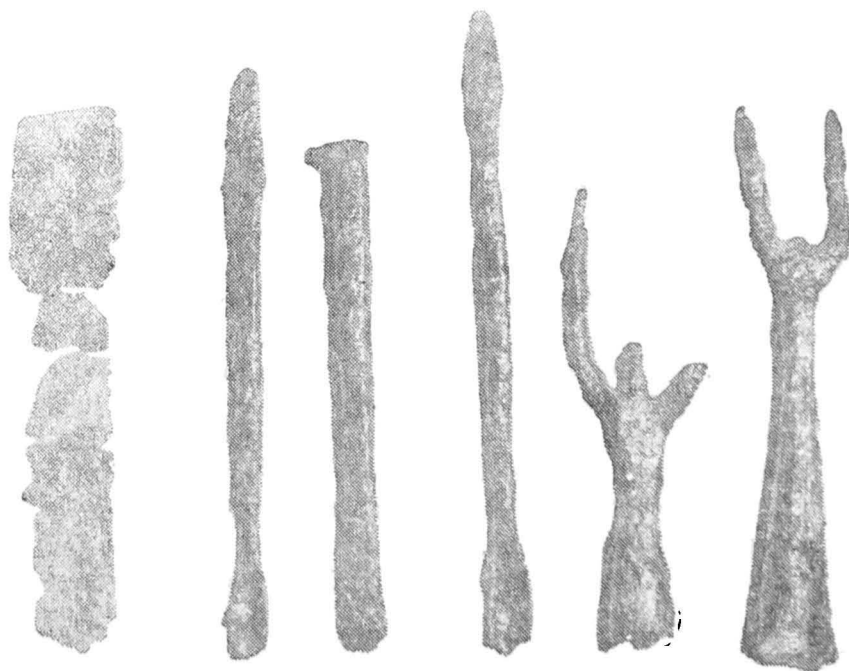
Unelte din depozitul de la Şoimi.