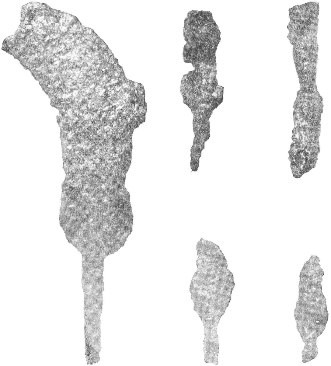
Unelte din depozitul de la Șoimi.