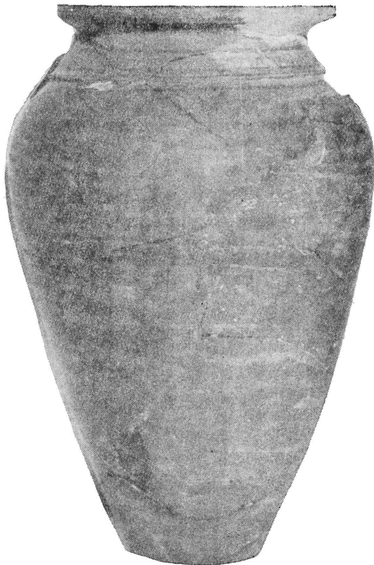
Pl. IV. Chiup descoperit în Bihor (I), lucrat din pastă cenușie-săpunoasă și ornamentat cu linii lustruite. Muzeul din Oradea, Inv. nr. 3074).