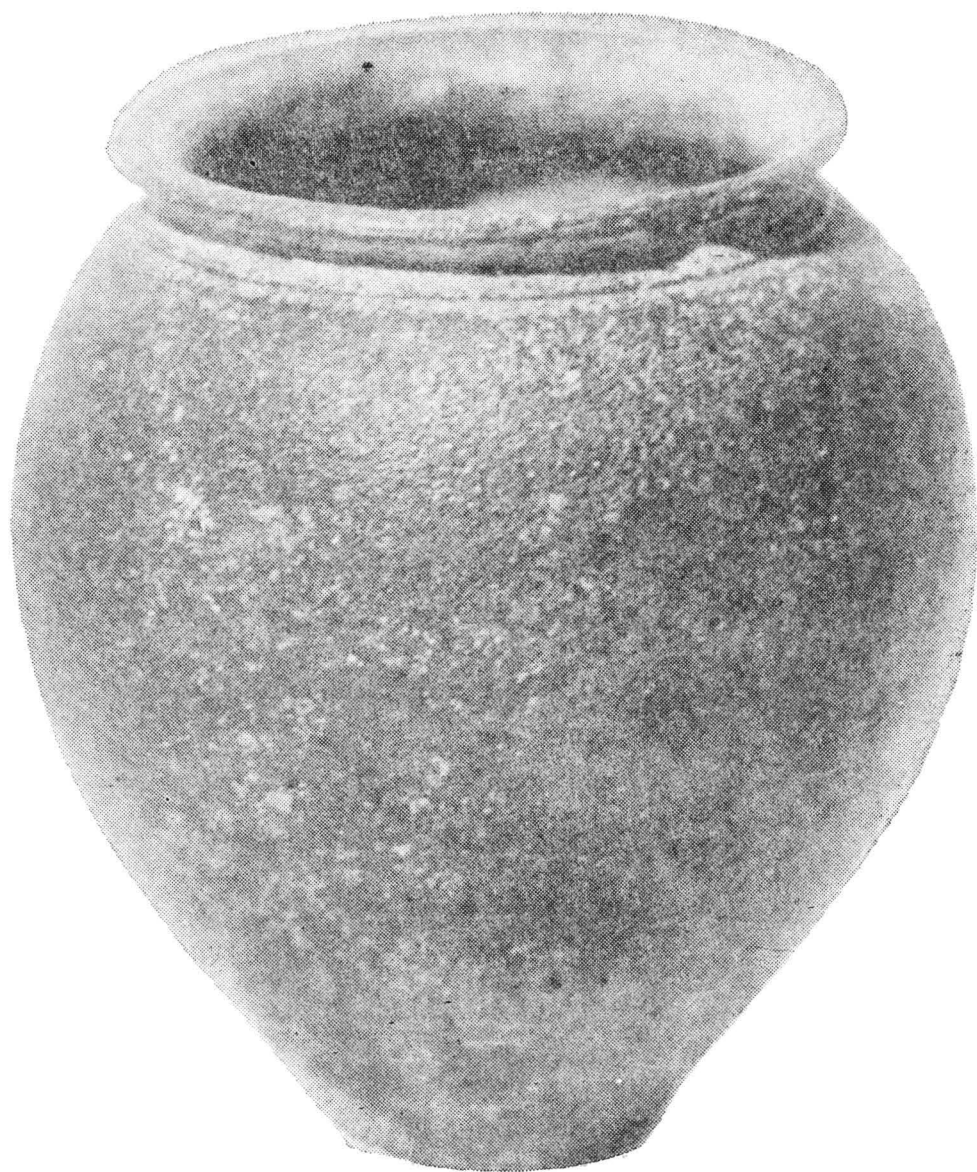
Pl. XIII. Vas-miniatură în formă de chiup descoperit în Bihor (III), lucrat din pastă de culoare negricioasă cu aspect zgrunțuros. Muzeul din Oradea, Inv. nr. 6802.