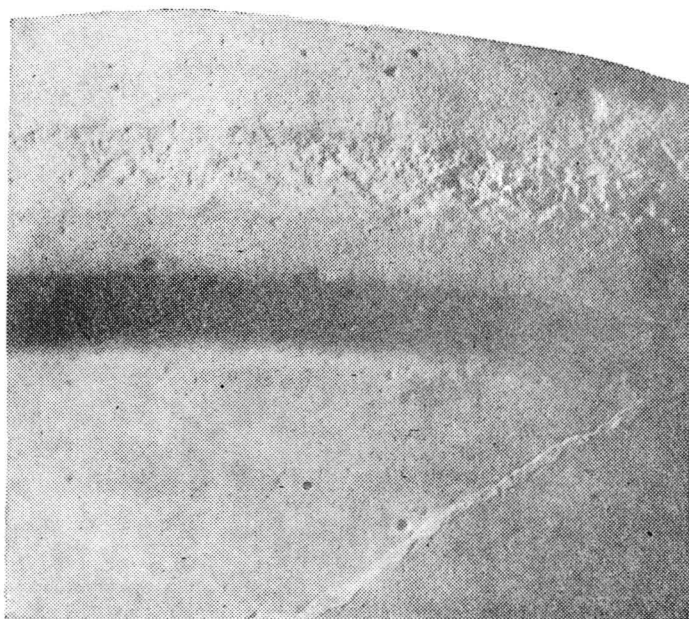
Pl. II. Chiup descoperit la Cighid (J. Bihor). a. Fragmentul de buză ce a fost salvat și restaurat. b. Detaliu din ornamentul de pe muchia exterioară a buzei (Muzeul din Oradea, Inv. nr. 10461).