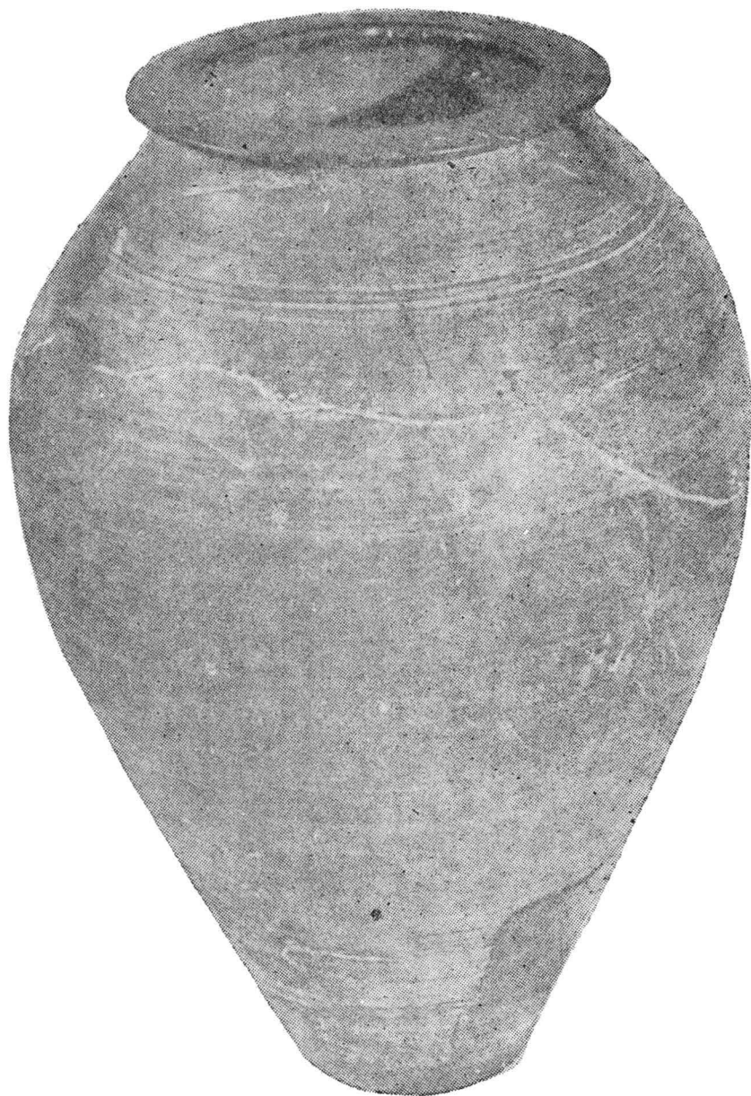
Pl. VI. Chiup descoperit în Bihor (II) lucrat din pastă cenușie-cimentoașă, ornamentat cu nervuri tehnologice pe gît. Muzeul din Oradea, Inv. Nr. 3078.