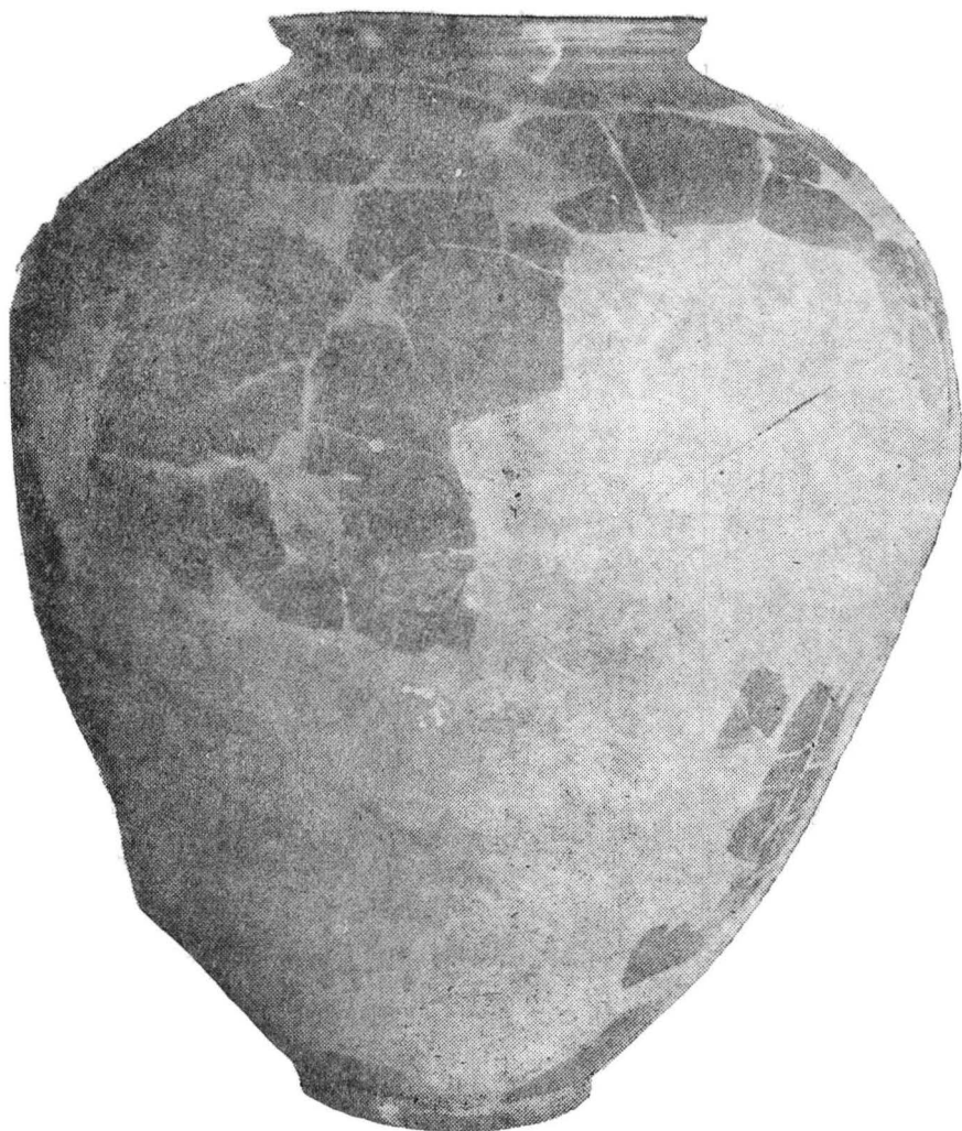
Pl. I. Chiup descoperit în cetatea dacică de la Blidaru (sec. I. î.e.n.—II. e.n.), deținut de Muzeul de Istorie al Transilvaniei din Cluj-Napoca (Inv. p. 3980), păstrat în custodie de Muzeul din Oradea.