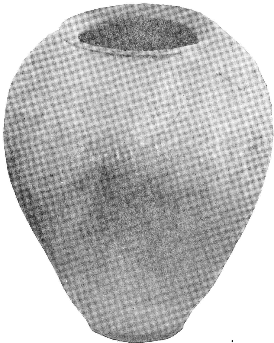
Pl. VIII. Chiup descoperit la Valea lui Mihai I, lucrat din pastă cenușie cimentoasă și ornamentat cu benzi de linii simple și în val cu pieptenele. Muzeul din Oradea, Inv. Nr. 13111.