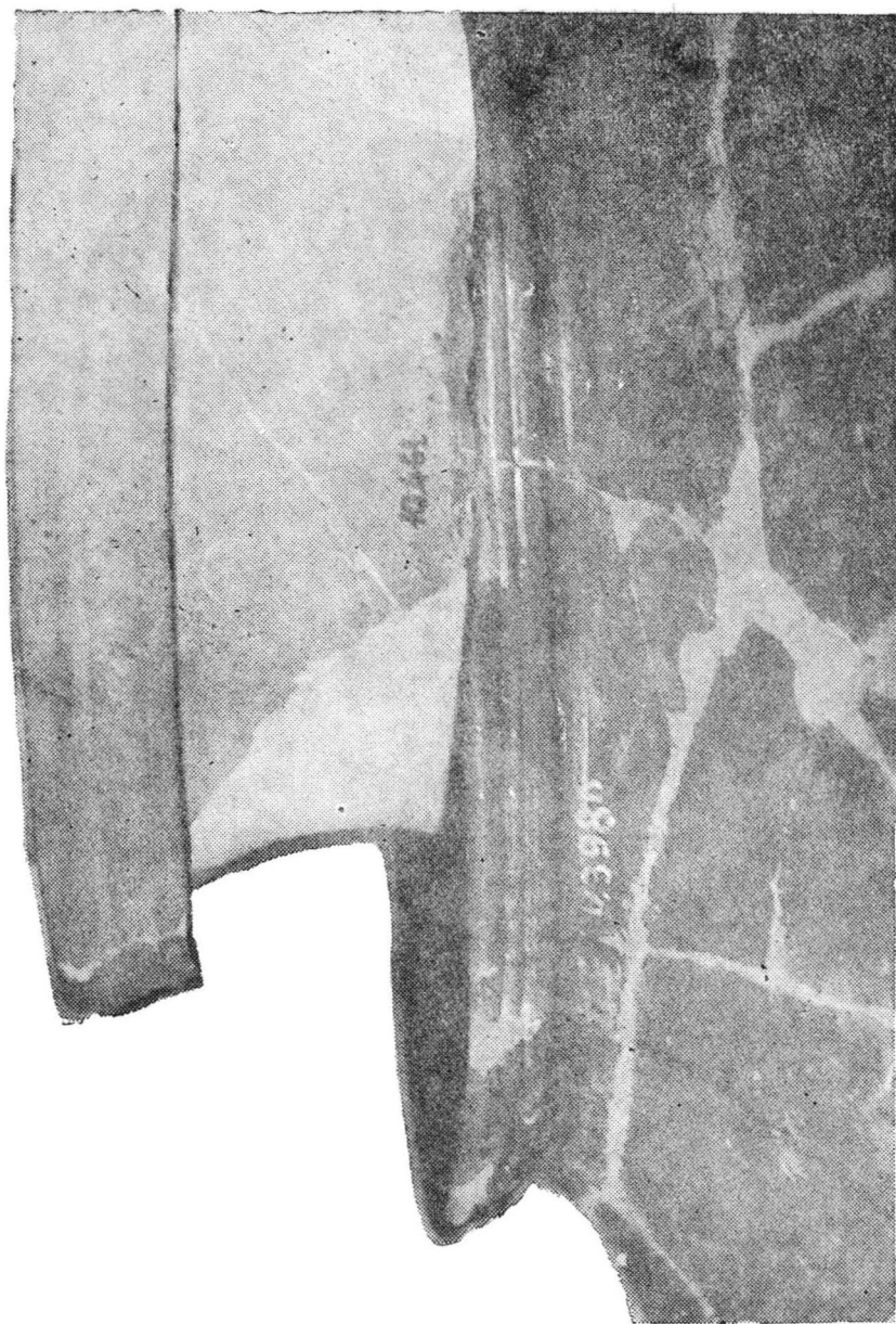
Pl. III. Detaliu cu buzele celor două chipuri de la Blidaru, J. Hunedoara (jos) și Cighid, J. Bihor (sus).