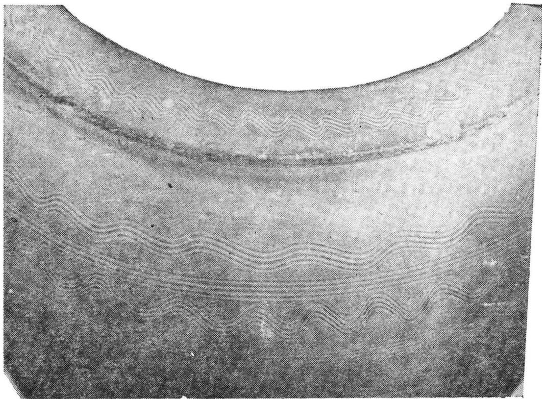
Pl. XII. Chiup descoperit la Oradea, detaliu cu ornamentele de pe umăr și buză constând din benzi simple și în val (B).