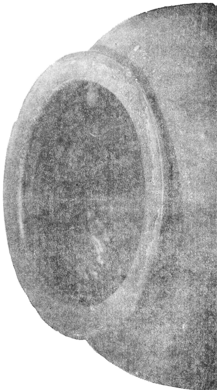
Pl. XV. Chiup descoperit în Bihor (IV); detaliu cu profilul buzei.