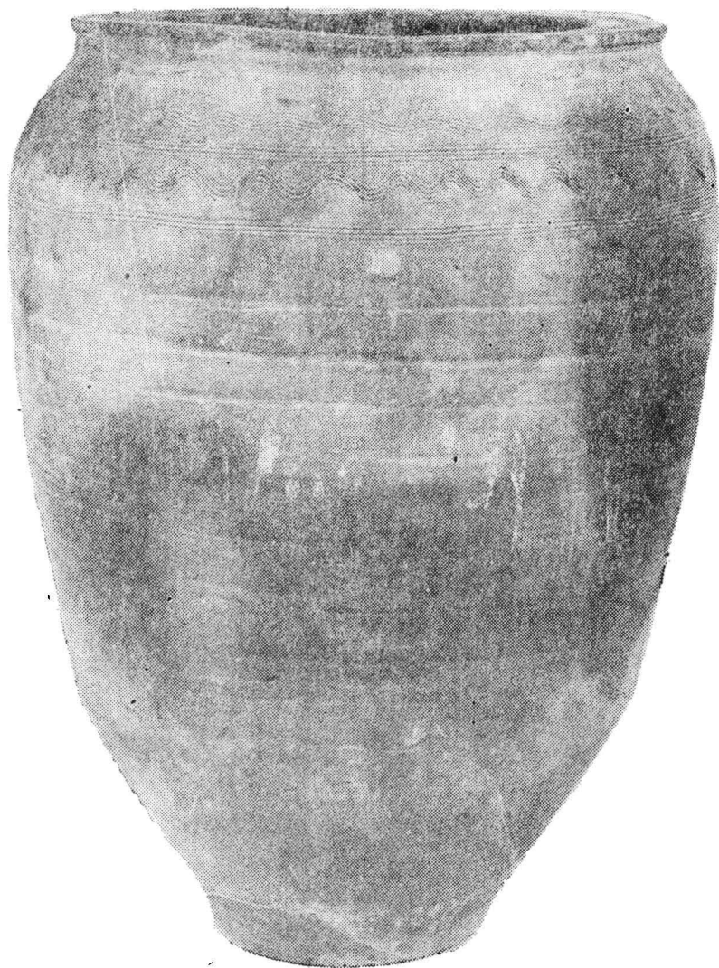
Pl. X. Chiup descoperit la Oradea, probabil în cartierul „Salca”, lucrat din pastă cenușie-cimentoasă și ornamentat pe buză și pe umăr cu benzi de linii simple și în val. Muzeul din Oradea, Inv. Nr. 3079.