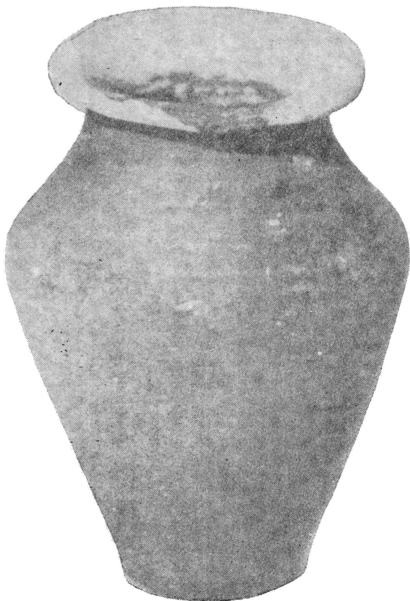
Pl. V. Vas-miniatură în formă de chiup descoperit la Santăul Mic, J. Bihor, Muzeul din Oradea, Inv. nr. 3078.