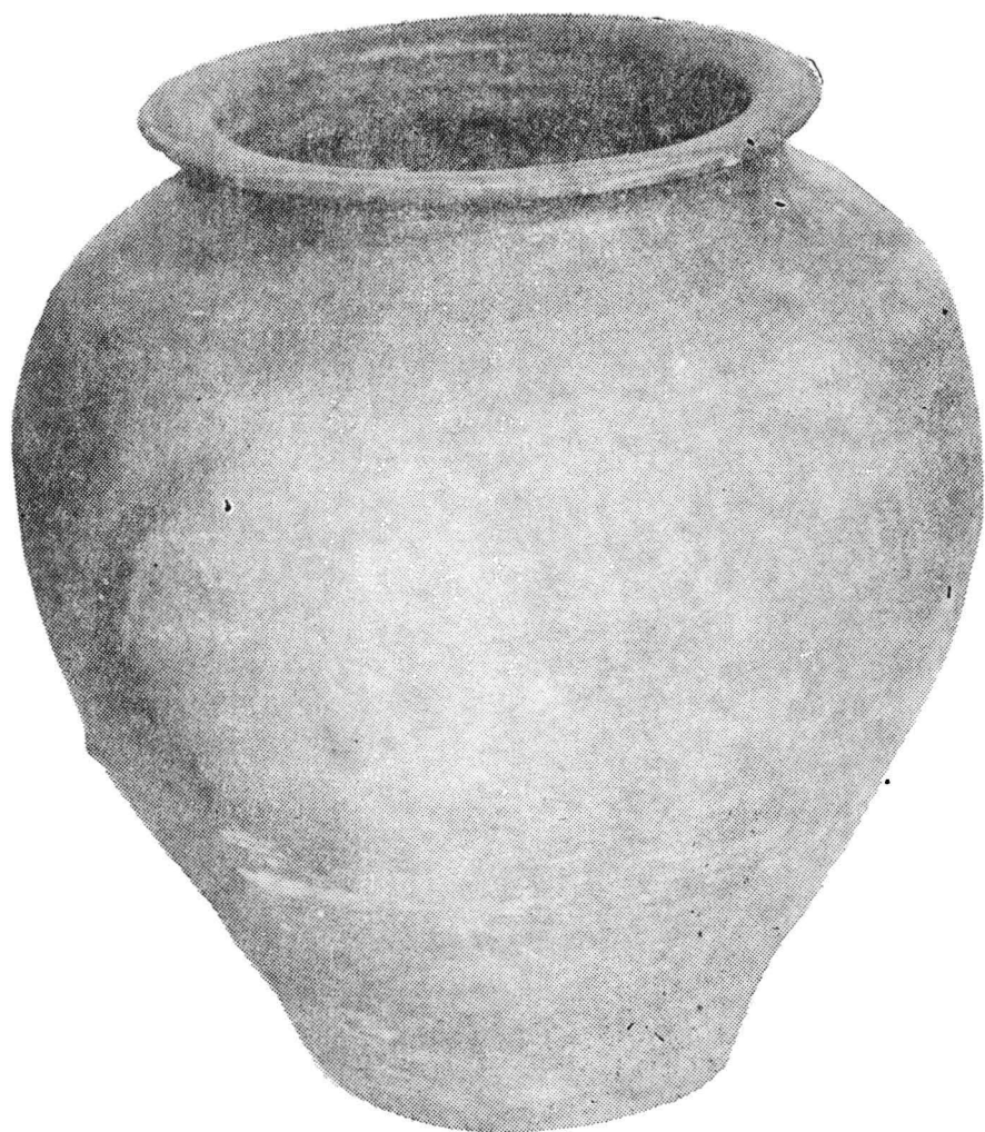
Pl. XIV. Chiup descoperit în Bihor (IV), lucrat din pastă de culoare negricioasă cu aspect zgrunțuros. Muzeul din Oradea. Expoziția permanentă a secției de istorie.