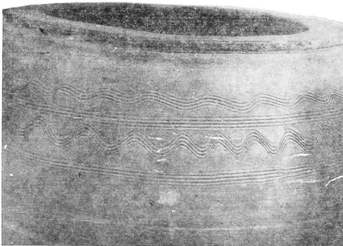
Pl. XI. Chiup descoperit la Odadea, detaliu cu ornamentele de pe umăr constind din benzi simple și în val (A).