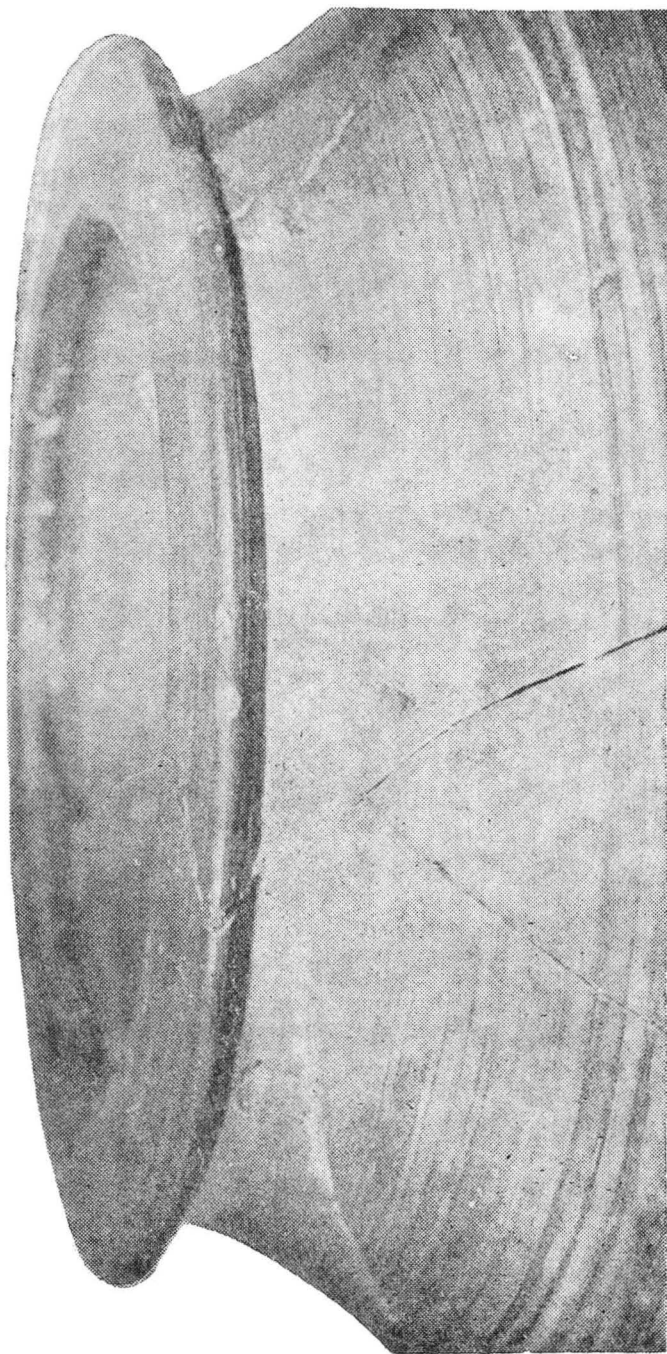
Pl. VII. Detaliu cu gura chiupului descoperit în Bihor (II).