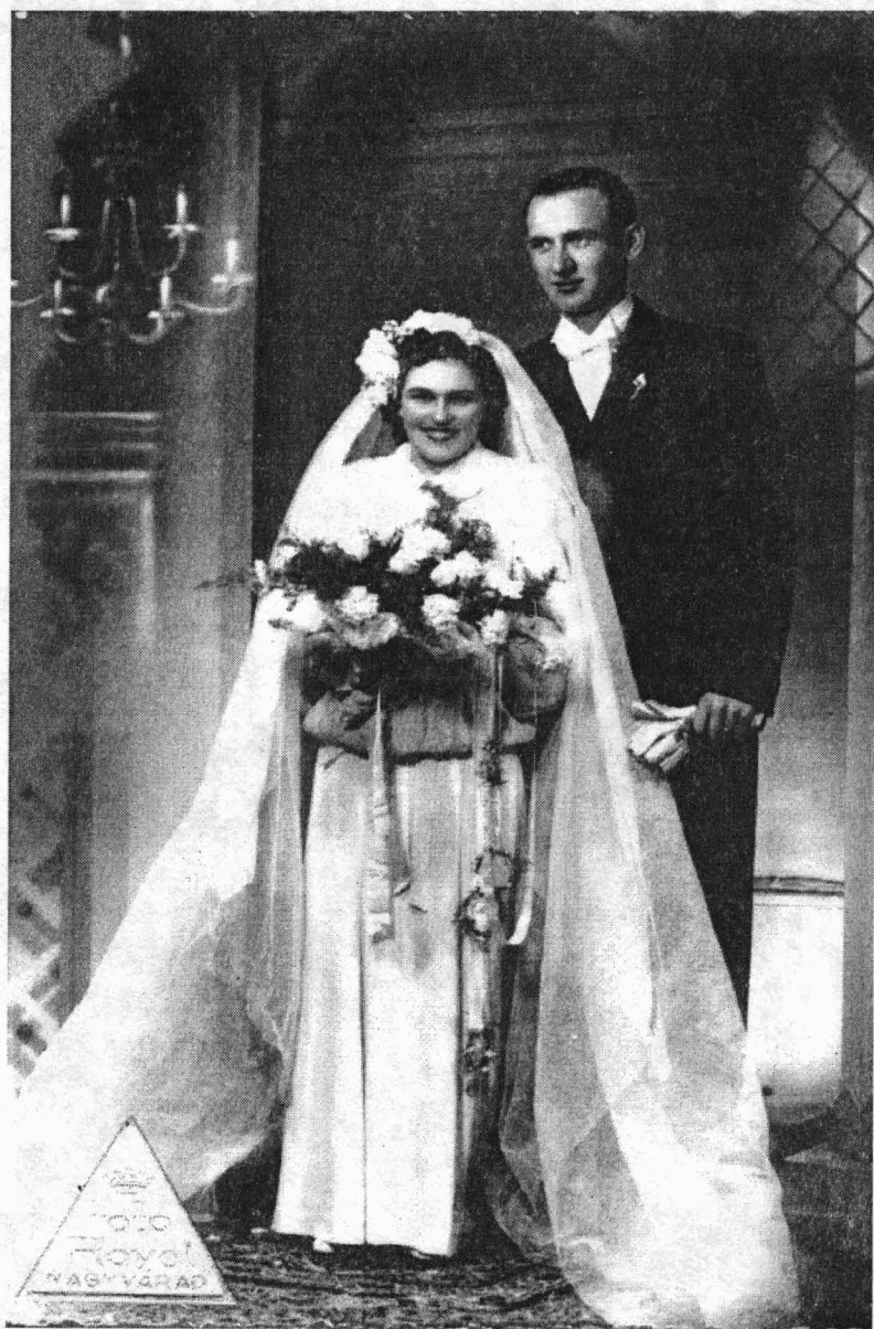
Fig. 2 FOTOGRAFIE DE NUNTĂ

Circa 1945, atelier Foto Royal , 8,5 × 13,5 cm