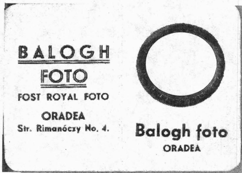
Fig. 3a. Verso-ul fotografiei, cu marca atelierului Verso de la photographie, avec la marque de l'atelier