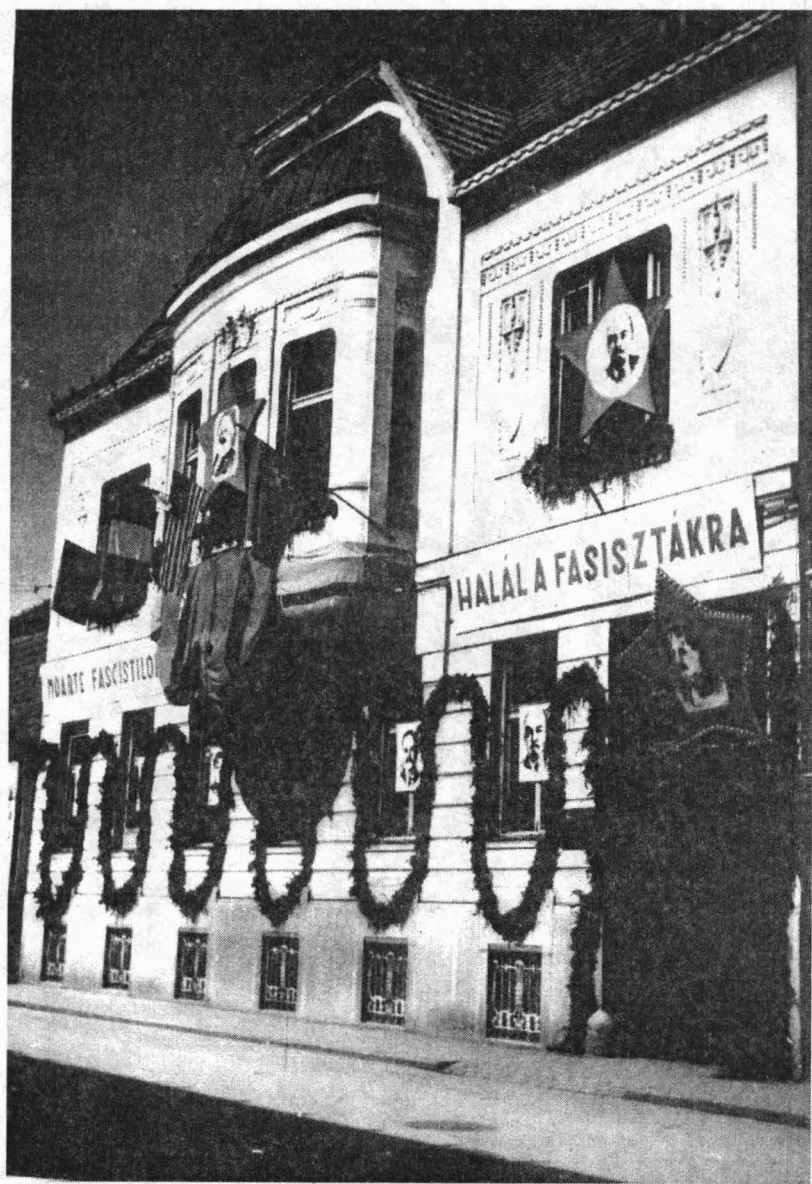
Fig. 1. FAȚADA SEDIULUI COMITETULUI DEMOCRATIC EVREIESC DIN ORADEA, 1 mai 1945, atelier Fotorevü, 9×14 cm

© Muzeul Țării Crișurilor – Oradea, Secția de Istorie, nr. inv. 4597 FAÇADE DU SIEGE DU COMITÉ DÉMOCRATIQUE JUIF D'ORADEA