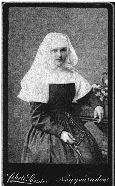
Portretul unei călugărițe

La personnalité et l'activité de Sándor Fekete se situent, du point de vue de l'histoire de la photographie à Oradea, à la jonction de deux époques. Avec l'ouverture de son atelier en 1884 s'achève la période des premiers ateliers photographiques et commence la période classique de l'ancienne photographie. En tant qu'artiste photographe, il reste un maître du portrait, même s'il fut, au carrefour des XIX e et XX e siècles, un des meilleurs photographes de paysages et de bâtiments.