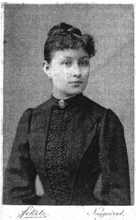
Portretul unei tinere

Circa 1890, 6×9,5 cm (format carte de visite )