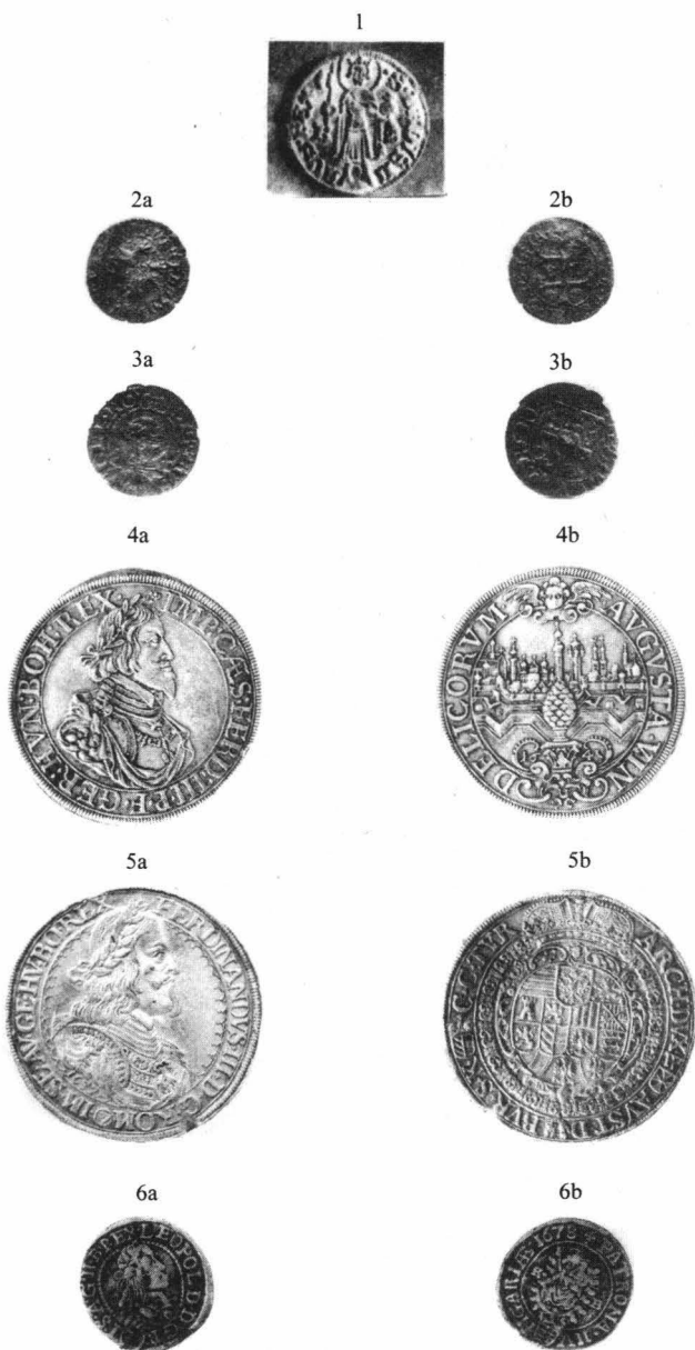
Pl. I. 1. Cefa- Intravilan, florin din aur emis de Sigismund de Luxemburg. 2 a-b Cefa-Intravilan, dinar din argint emis de Sigismund de Luxemburg. 3 a-b Cefa-Intravilan, gros polonez din argint (sec. XVII). 4 a-b, 5 a-b Cefa-Râturi, taleri imperiali din argint (1641, 1657). 6 a-b Cefa- Intravilan, monedă din argint în valoare de 3 crețari (1678)