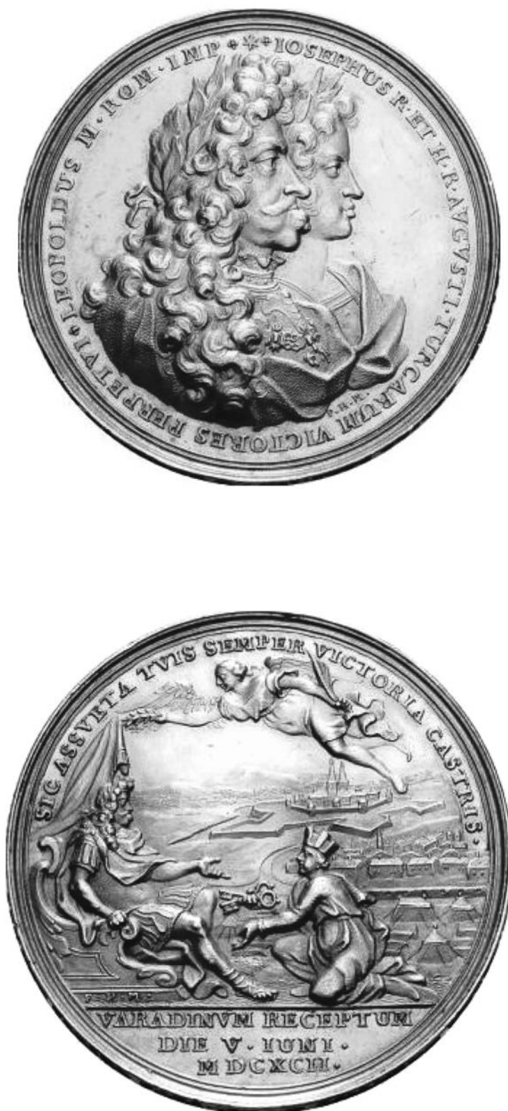
Planșa III, P. H. Muller, Medalie din aur (imagine mărită)