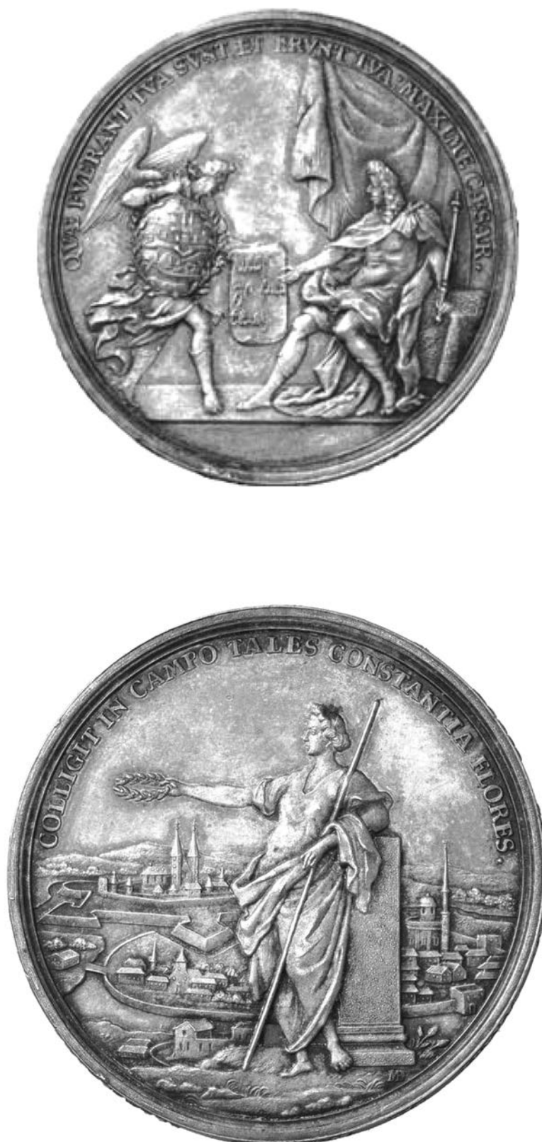
Planșa II – E. Farber, M. Brunner, Medalie din argint (imagine mărită)