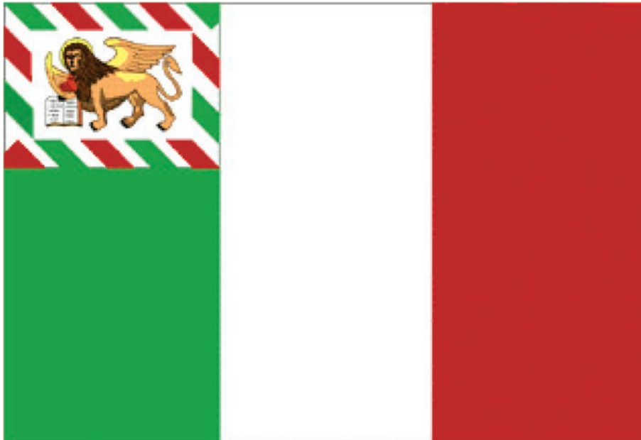
Bandiera della Repubblica di S. Marco, 1848-1849

Key words: Venice, Risorgimento, Serenissima, I.R. Government, Kingdom of Italy.