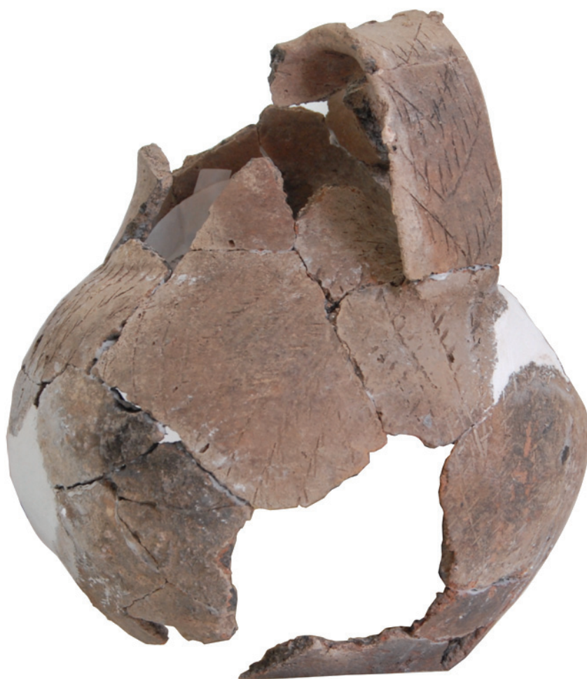
Fig. 6. Cana reconstituită (foto)