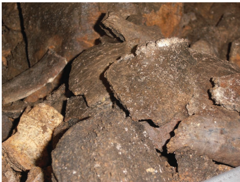
Fig. 5. Detaliu 2 cu depunerea