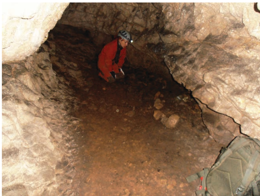
Fig. 2. Galeria cu depunerea Coțofeni