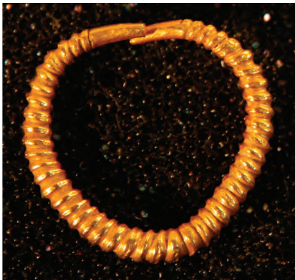
Fig.4. Betfia inel, imagine mărită.