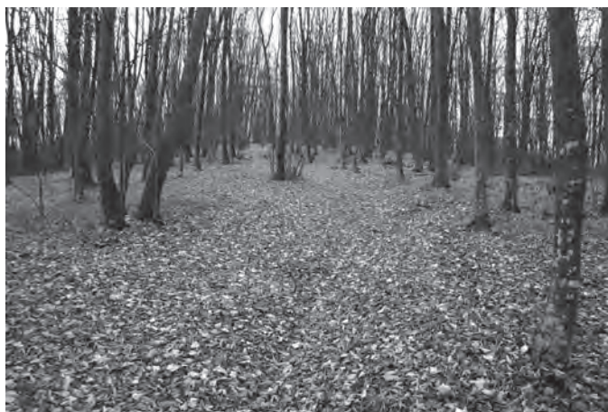
Fig.1. Betfia-zona descoperirii.

Asocierea piesei preistorice cu un denar roman, poate fi pusă pe seama descoperirii ei de către vreun soldat care, a găsit-o întâmplător, caz deloc singular 1 .