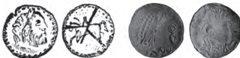
Fig. 5. Monede dacice de la Piatra Craivii (1 – tip greu identificabil; 2 – tip Aiud-Cugir) (după Roska 1944 - 1; Berciu et al. 1965 - 2)