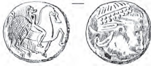
Fig. 1. Monedă geto-dacică de tip Aninoasa-Dobrești de la Bucium-Corabia (apud Téglás 1890)