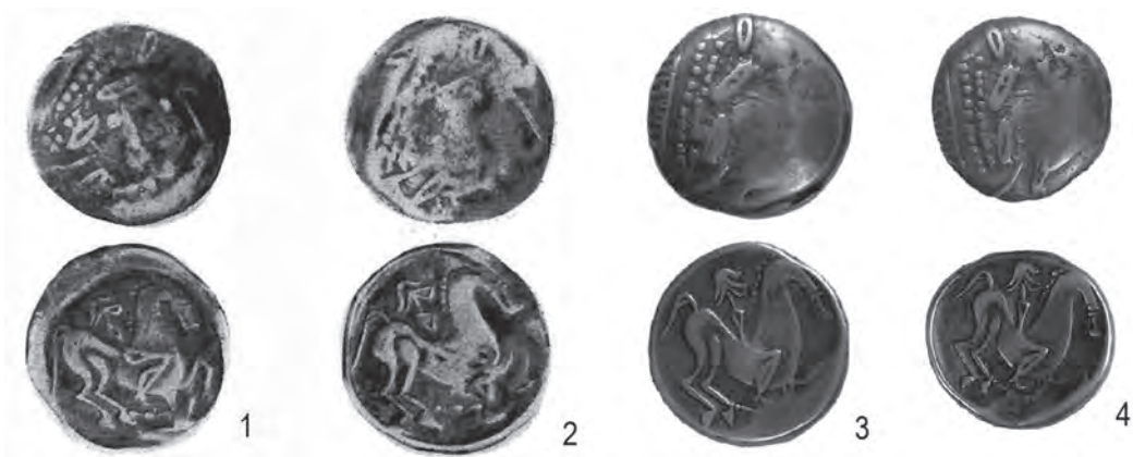
Fig. 2. Monede de tip Aninoasa-Dobrești: locuri necunoscute – Cabinetul Academiei Române (1-2) și colecția Alexandru Borza Alba Iulia (3-4) (apud Preda 1973 – 1-2; Suciu 2003 – 3-4)