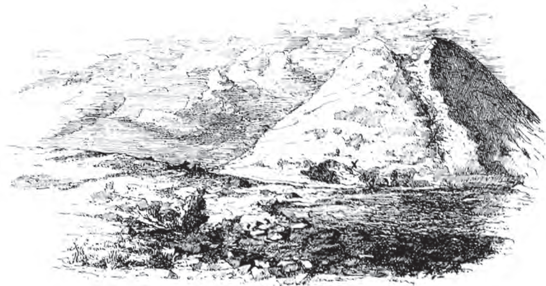
Fig. 3. Bucium. Imagine cu muntele Corabia și șanțul Ieruga (apud Téglás 1890)