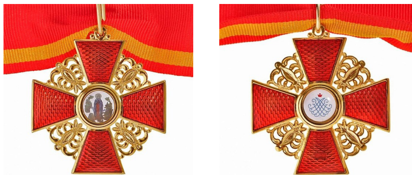
Fig. 17 - 18