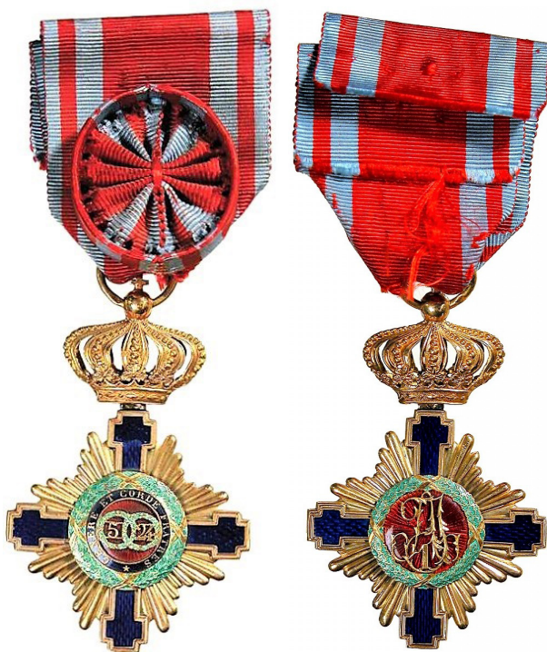
Fig. 5 - 6