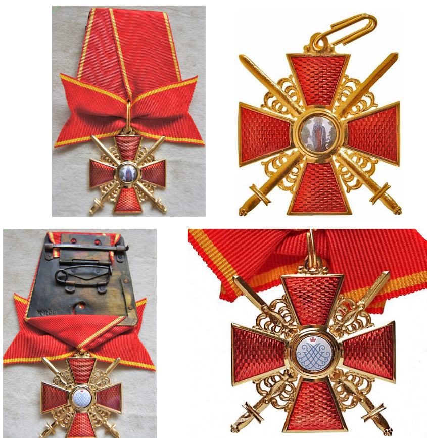
Fig. 19 - 22