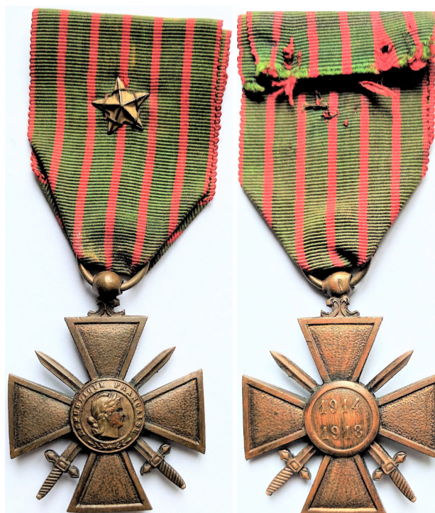
Fig. 15 - 16