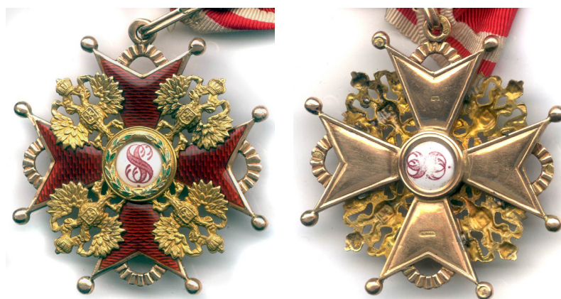
Fig. 23 - 24