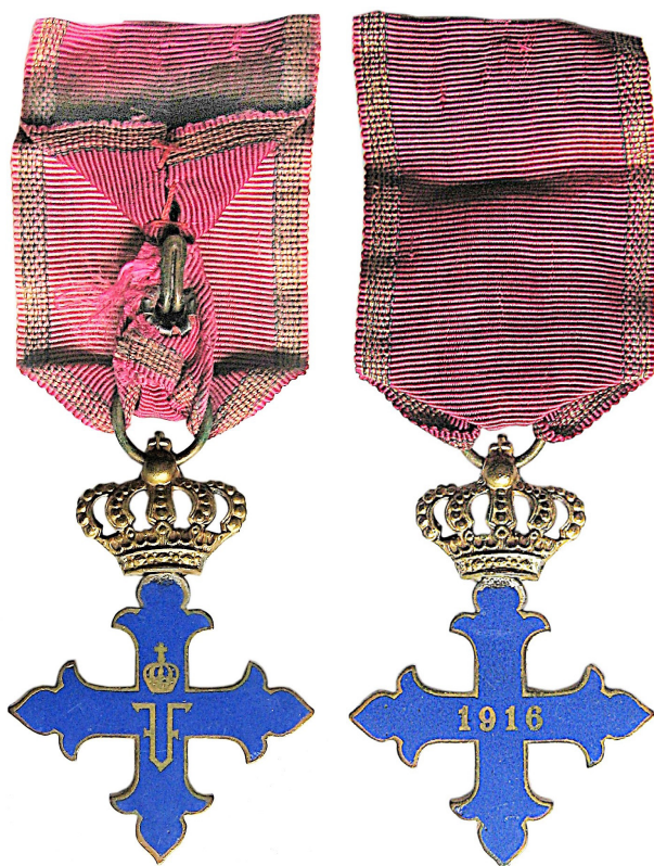
Fig. 1 - 2