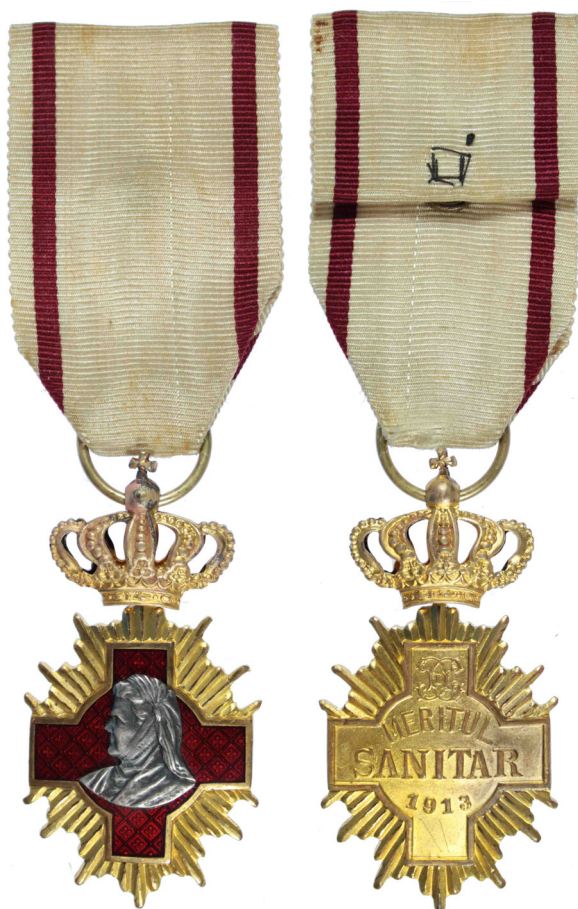
Fig. 13 - 14