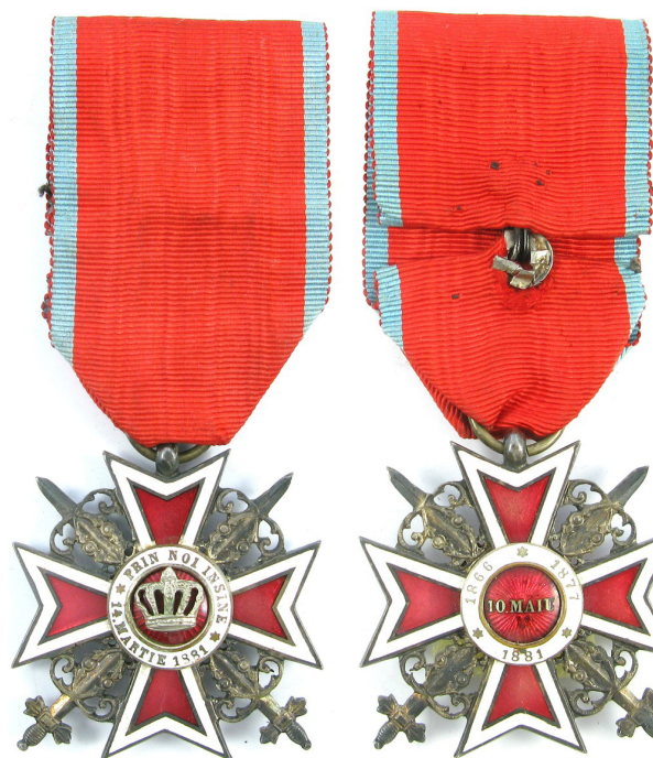
Fig. 7 - 8