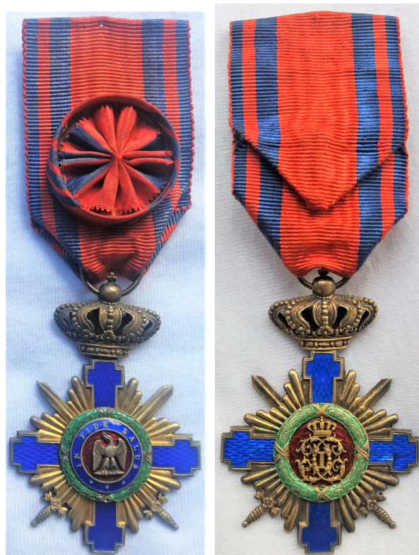
Fig. 3 - 4