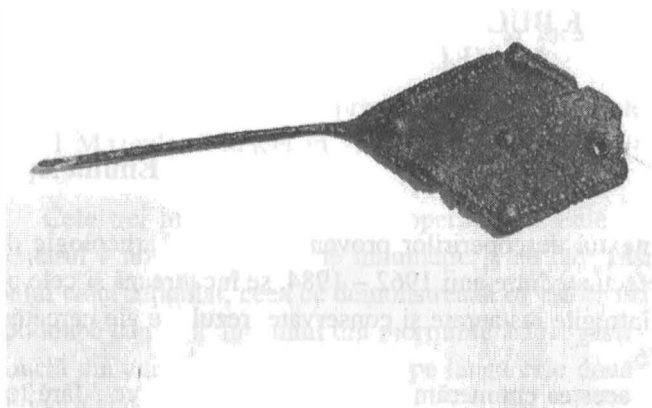
Figura 1. Acul de păr