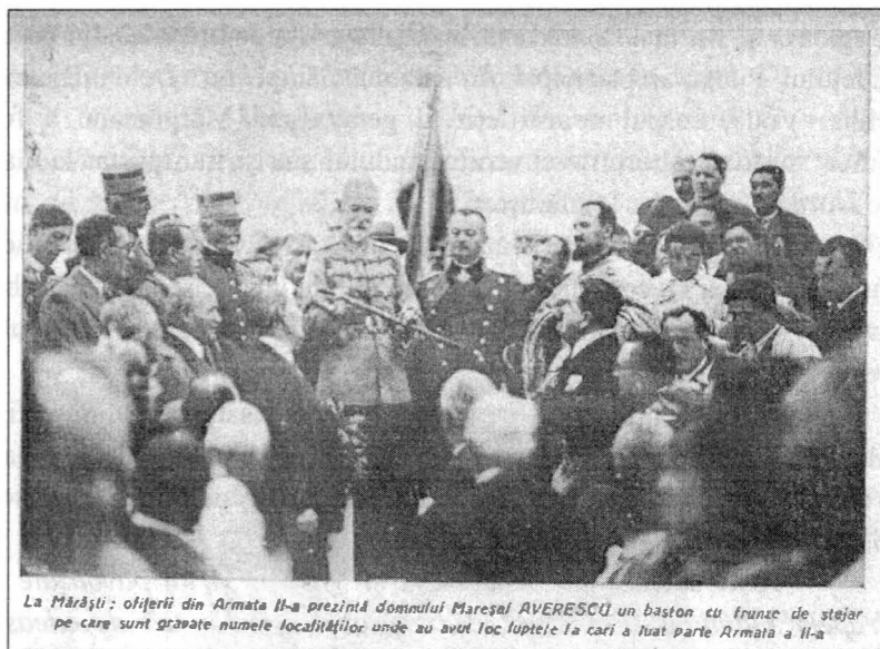
La Mărăști: ofițerii din Armata II-a prezintă domnului Mareșal AVERESCŪ un baston cu frunze de stejar pe care sunt gravate numele localităților unde au avut loc luptele la cari a luat parte Armata a II-a

Întreaga serbare s-a desfășurat în cea mai perfectă ordine” 91 .