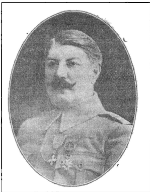
Generalul Alexandru Mărgineanu

Generalul Mărgineanu „Acum doarme somnul de veci în mijlocul vitejilor ce i-a comandat. Depe înălțimile Mărăștilor ochiul său de vultur, deprins să deruteze dușmanul în zarea nesfârșită, în mijlocul umbrelor poate privi în liniște crestele Carpaților pe care le-a apărât” 96 .