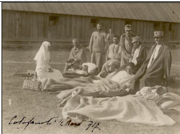
Spitalul din Coțofănești – 1917