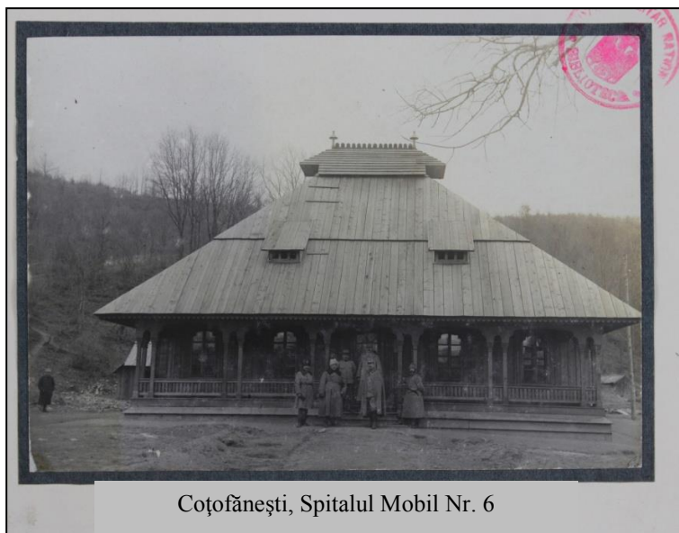
Coțofănești, Spitalul Mobil Nr. 6

Spitalul de aici, construit de generalul Arthur Văitoianu **, beneficia nu doar de o priveliște pitorească, ci și de medici destoinici