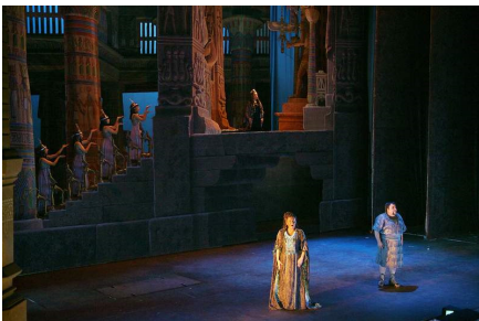
Scenă din AIDA

Aida barceloneză este o clasică producție monumentală datând din 1945 (!), cu longevitate explicabilă prin valoarea minuțiozității tratării, prin preocuparea pentru detaliu. Rar se mai întâlnesc astăzi asemenea puneri în pagină. Cu toată depărtarea de un anume modernism – deseori deplasat, care mai inundă producțiile momentului -, nu am avut deloc impresia unei variante de... muzeu; în ambientul dat, eroii, coriștii, balerinii, numeroșii figuranți se mișcă veridic, abundent și implicat, relațiile între participanții la acțiune sunt firești, naturale.