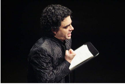
Rolando Villazon

În această a doua secțiune a recitalului, tenorul a ieșit – surprinzător – de două ori din scenă, între piese, revenind după 1-2 minute care au părut o eternitate. Sigur că publicul, sensibilizat de dispariția prelungă de pe afiș a lui Rolando, s-a gândit la ce e mai rău. În plus, o răgușeală neașteptată pe câteva note centrale ale liedului Al amor (Obradors) l-a făcut să se întrerupă și să părăsească din nou scena, cerându-și scuze la revenire și explicând că faptul că nu a cântat atâta timp și dorința-i fierbinte de a se prezenta la cel mai înalt nivel în fața iubitelui public barcelonez l-au stresat peste măsură. Finalul (alte lieduri de Obradors și câteva bisuri din repertoriul spaniol tradițional) l-a găsit dezlănțuit, proiectând în marea sală acute prelungi și penetrante, încoronând o prestație de valoare și probând că izbânda a fost totală. Într-adevăr, satisfacția noastră, a celor 3500 de spectatori, a fost că glasul lui Rolando se situează la parametri normali, are puritatea și curățenia binecunoscute, ceea ce înseamnă că pauza vocală i-a folosit. Pe chipul iluminat al tenorului, fericirea era fără margini.