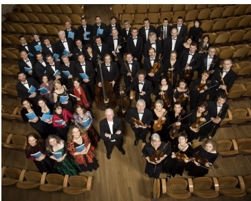
Les Arts Florissants & William Christie

După-amiază magică la Ateneu cu orchestra și corul Les Arts Florissants, conduse de William Christie. O incursiune în baroc, prin oratoriul Susanna, HWV 66 de Haendel, opus mai puțin cunoscut dar revela acum nouă prin performanța ansamblului, dirijorului și soliștilor. Și dacă statismul spectacolului Oedipe a transformat o operă într-un oratoriu, tensiunea și expresia induse de William Christie au convertit oratoriul Susanna într-o adevărată operă. Mare artă! Limpezime de sunet instrumental, rafinament de cor, simț dramaturgic, precizie.