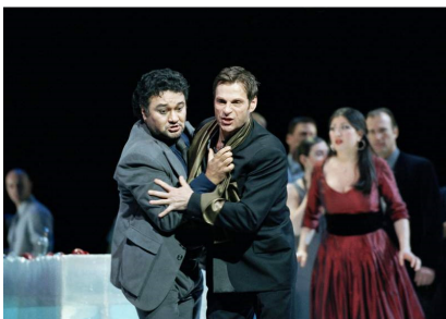
Ramon Vargas și Simon Keenlyside

Citesc un interviu foarte recent pe care Ioan Holender l-a acordat unui post de radio american. Afirma directorul Operei de Stat din Viena că, dacă ar începe o nouă viață, și-ar dori să conducă o instituție de concerte, să facă numai muzică, fără să aibă de-a face cu regizorii. Quo vadis, opera?