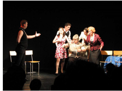
Scenă din „Căsătoria secretă” (Iași))