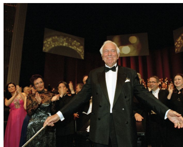
ANNA NETREBKO, WALTRAUD MEIER, IOAN HOLENDER, BERTRAND DE BILLY, SIMONE YOUNG, JOHAN BOTHA