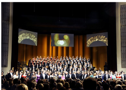
Final - Foto Wiener Staatsoper GmbH Axel Zeininger