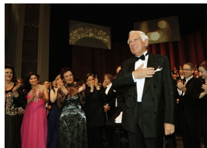
VIOLETA URMANA, ANNA NETREBKO, WALTRAUD MEIER, IOAN HOLENDER, BERTRAND DE BILLY, SIMONE YOUNG