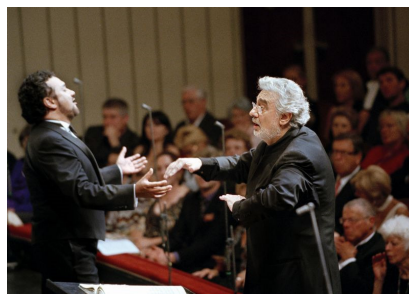
RAMON VARGAS, PLACIDO DOMINGO - Foto Wiener Staatsoper GmbH Axel Zeininger