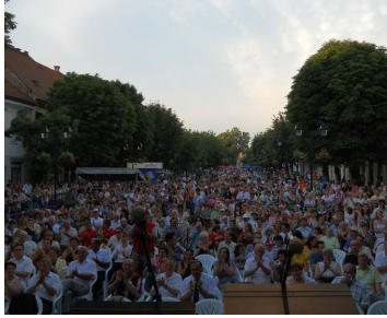
Imagine din public