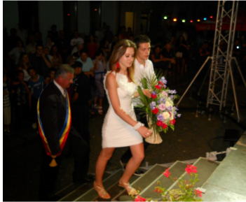
Flori pentru artiști