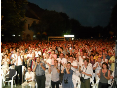
Aplauze pentru artiști