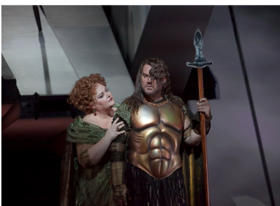
Fricka (mezzosoprana Stephanie Blythe) și Wotan (bas-baritonul Bryn Terfel)

La prezentarea dinaintea spectacolului, în culise, însuși regizorul a explicat stupefianta realizare. Cele trei cântărețe erau încorsetate în chingi la nivelul torsului, suspendate de cabluri, iar tehnologia interactivă computerizată făcea ca în urma mișcărilor de brațe, de trupuri și chiar a sunetului vocilor, să fie generate bule de aer care dădeau senzația învolburării apelor Rinului, a căror curgere era efectul unei proiecții. Impresii de neuitat! Cinematografie de cea mai bună calitate pe o scenă de operă. Înainte de intrarea în corsete, cele trei tinere suple (nu se putea altfel!) erau obligate să facă 30 de minute de exerciții fizice. După care... aveau de cântat, nu glumă.