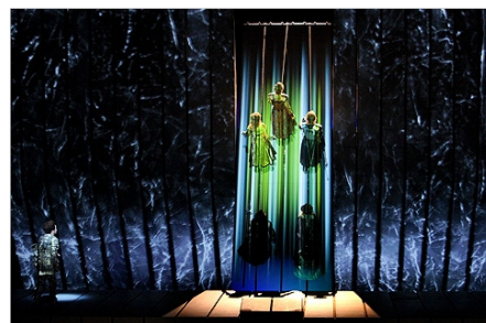
Intrarea în Walhalla