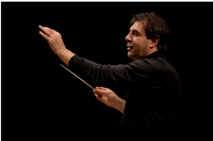
dirijorul Daniele GATTI

senzație împlinită în grandiosul final, Allegro scherzando. Denis Matsuev dispune de o impresionantă forță, de o fabuloasă tehnică. În fața unei orchestre în care excelează „Streich”-ul, Antonio Pappano a etalat o gestică largă, predispusă către elanul romantic. Este genul de dirijor pentru care spectacolul oferit de pe podium nu rămâne singular și nesuștinut de lecturi de profunzime.