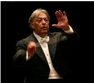
dirijorul Zubin MEHTA

... este un obișnuit al festivalurilor enesciene. A vizitat Bucureștiul încă de tânăr (1967, la 31 de ani), când din prima clipă a bulversat auditoriul și critica. A ajuns între timp legendar și desfășoară o carieră fabuloasă în simfonic și operă. Bagheta lui vădește o cultură interdisciplinară profundă, conexează sonurile cu filosofia opusurilor și le redă în sensurile celei mai pure tradiții. Nimic nu este exagerat sau șocant, construcțiile sunt unitare și echilibrate. Dimensionările masive se întrepătrund firesc cu cele fine. Gestică sa nu este largă dar precisă, tăioasă și se bazează pe o economicitate proprie, din care punctează esențialul când trebuie și cum trebuie. Inflamările cuprind însă totul, pachete instrumentale și chiar publicul fascinat.