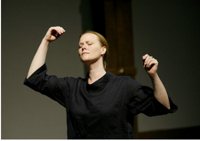
Jessica Pratt (repetiție)

În rolul titular, soprana australiancă Jessica Pratt s-a impus de la bun început prin frumoase sunete în pianissimo, moi, aerate (aria „Occhi miei piangeste assai... Oh cara immagine”) și printr-o dăruire totală în marele duet cu mezzosoprana Daniela Barcellona (Ottone, în travesti)... o scenă de dragoste în care Pier’Alli le-a impus interpretelor o gestică subtilă, cu atingeri firave, de mare efect.