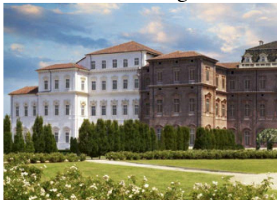
La Venaria Reale