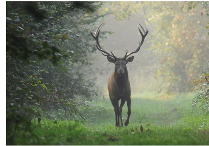
Parco la Mandria