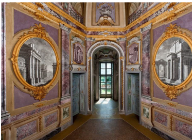
Stupinigi (sală în Palatul de vânătoare)