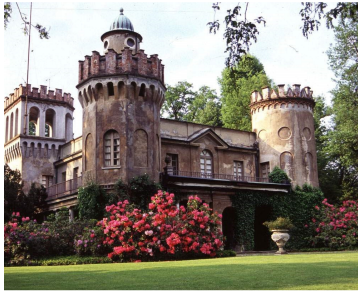
Villa dei Laghi

Daniele, Sala della Colazione, Sala Ottagonale, Sala dei Medaglioni, Sala da Ballo în care s-a reconstituit Sala tronului). O explozie a culorilor, strălucirii, decorațiunilor abundente, costumelor spectaculoase de epocă. Andrea Andermann, cu sprijinul regizorului Carlo Verdone și al autorului imaginii, Ennio Guarnieri, a reușit cadraje de vis, luxuriante și totodată poetice, printre care inspiratele inserturi de animație (Annalisa Corsi și Maurizio Forestieri) au făcut ca „fabula” transmisă live să pulseze atractiv.