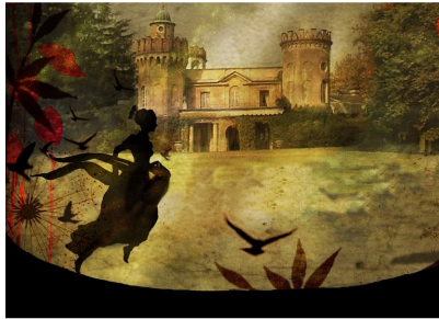
Villa dei Laghi