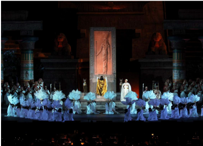
Scenă din actul I

final. La pasiv, aş nota un vibrato mai accentuat pe unele note centrale şi, dată fiind dorinţa de a epata, emiterea cu avânt sporit a unor sunuri înalte, cu rezultantă în situarea peste tonul corect. În aceeaşi direcţie, De León fragmentează chiar fraza muzicală pentru obţinerea unor efecte mai prelungi, spectaculoase, cum ar fi în ultima replică a actului al III-lea, „Io resto a te”.