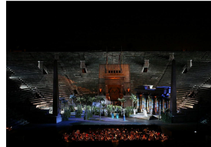
Scenă din actul al III-lea