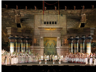
Scenă din actul al II-lea