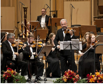
Dmitry Sitkovtesky

Despre prima lucrare interpretată, „Capriccio pentru vioară și orchestră” de Enescu în orchestrația lui Cornel Țăranu după schițele compozitorului, un opus plin de motive românești și orientale, dificil pentru solist, spun doar atât: ar fi păcat să nu se realizeze o înregistrare pe CD cu Dmitry Sitkovetsky, Royal Philharmonic Orchestra și Cristian Mandeal. Trei nume de lux.