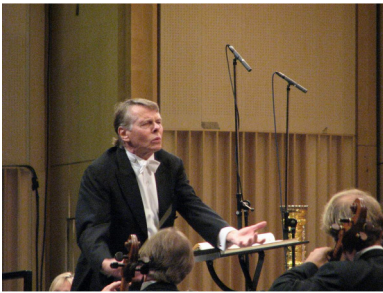
Mariss Jansons

Date fiind amintirile ultimei ediții a Festivalului George Enescu, sunt convins că prezența Royal Concertgebouw Orchestra din Amsterdam cu al său dirijor Mariss Jansons a fost așteptată frenetic. Dubla apariție a fost răsplătită pe de-a-ntregul, cu aprecieri la superlativ. Orchestra s-a confirmat ca mare ansamblu, Jansons ca mare șef. Privit, dirijorul emană – prin gestică-i amplă – o dăruire și o implicare profundă în expunerea texturii sonore, preocupat de întreg, de minuțioase subtilități la toate partidele, de dimensionări majestuoase, totul indus cu precizie milimetrică.