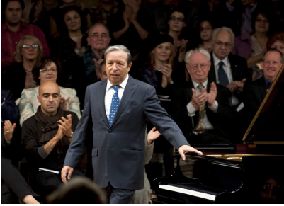
Murray Perahia

Imaginea lui Sviatoslav Richter mi-a apărut și ascultându-l pe Murray Perahia. „Sonata nr.23 în fa minor op.57, Appassionata” de Beethoven: forță telurică venită din acumulări și lupte interioare, magmă forjată în adâncimi de spirit, cascade sonore în impresionante vârtejuri, puteri nebănuite, gradații și contraste. Pentru puțină vreme, calmul și pacea s-au instaurat în partea secundă, „Andante con moto”, pentru ca finalul „Preso” să atingă dimensiuni fabuloase de turbulență expresivă.