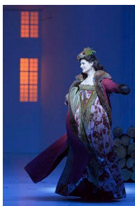
Anja Harteros