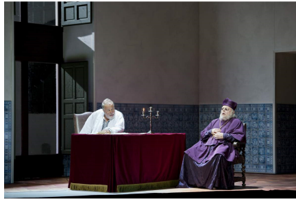
Matti Salminen și Eric Halfvarson