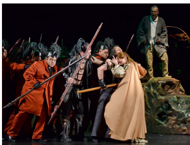
Scena finală (I Masnadieri)