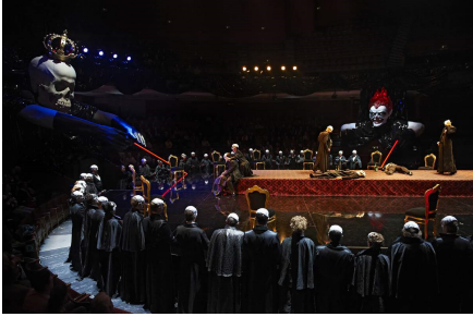
Scenă finală

Cvartetul principal și cei zece (!) soliști din rolurile mici au fost bine conduși de dirijorul Julian Reynolds, la pupitrul ansamblurilor Teatrului Regal La Monnaie. Șeful de orchestră cunoaște bine specificul lucrării, cursivitatea discursului muzical este asigurată, ca și tensiunea dramatică. Tempii au fost judicios aleși și ansamblurile concertato care le prefigurează pe cele ce vor veni mai târziu, în partiturile verdiene romantice, au avut echilibru și coerență.