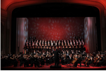
Corul și orchestra Operei