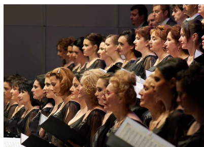
Corul Operei Naționale București