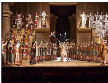
Scenă din primul act