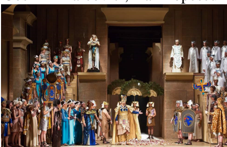
Scenă din actul al II-lea