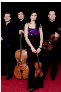
Cvartetul Belcea