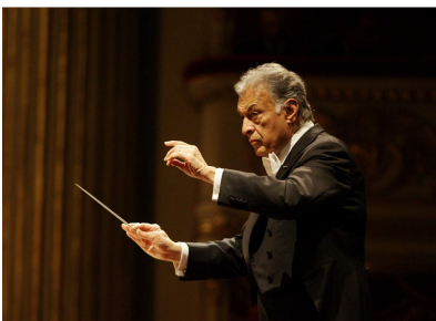
Zubin Mehta

Așa a fost și în cea de-a doua seară a prezenței sale la ediția cu numărul XXII a festivalului, la pupitrul Israel Philharmonic Orchestra, în care, spre bucuria noastră, a inclus Poemul simfonic „Vox Maris”, op.31 de George Enescu. Lectura va rămâne referențială. A ales tempi mai mișcați, dar coloristica s-a dovedit minuțioasă, ca o pânză impresionistă. Penel de maestru. Plastica a fost fără reproș, stazele mării s-au succedat fascinant, mergând către misterul care s-a regăsit abia în final, ca o dezlegare. Vocalizele flotante ale partidei feminine a Corului Filarmonicii „George Enescu” au servit de minune, ca de altfel prestația întregii formații pregătită de Iosif Ion Prunner.