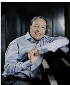
Murray Perahia

Reîntâlnirea cu celebrul Murray Perahia a fost unul din regalurile oferite de organizatori. Piese de Haydn („Sonata nr.31 Hob. XVI. 46 în La bemol Major”, „Variațiunile Hob. XVII. 6 în fa minor”) și Brahms („Balada nr.3 op.118 în sol minor”, trei „Intermezzi”, „Capriccio nr.1 op.116 în re minor”) au fost redat ascetic, cu sobrietate bachiană și curățenie spirituală. „Marea sonată nr.29 pentru Hammerklavier op.106” de Beethoven a avut forța Titanului de la Bonn, o forță telurică, de extremă turbulență. Păcat că dialogul lui Perahia cu pianul a fost tulburat de niște bubuieli sinistre, venite din Piața George Enescu, unde o formație rock își expunea decibelii. Cu toate intervențiile preventive ale organizatorilor, cu tot protestul lor prompt în timpul recitalului, nimic nu s-a schimbat în acea seară. Doar în următoarele.