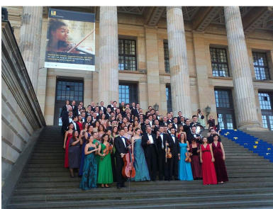
Orchestra Română de Tineret

Și actuala ediție a renumitului eveniment bucureștean, național și internațional dedicat marelui George Enescu, deși mai scurtă cu șase zile față de anterioara din 2013, este bogată și densă. S-au menținut punctele de atracție – marile orchestre, concertele camerale, recitalurile sau seratele dedicate literaturii baroce, manifestările adiacente. A fost ultima întâlnire cu lumea festivalului a lui Ioan Holender, director artistic din 2005. Pentru anul 2017, singurul lucru cert la ora actuală este directoratul onorific, pe care l-a acceptat marele dirijor Zubin Mehta.