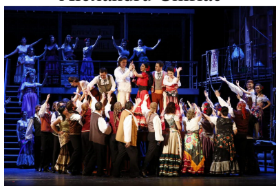
Final actul II