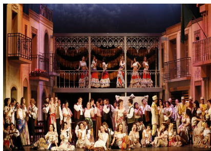
Scenă din primul act