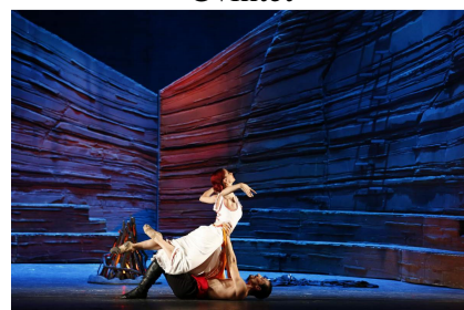
Antract actul III