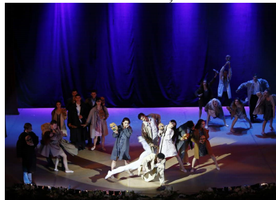
Imagine all the people