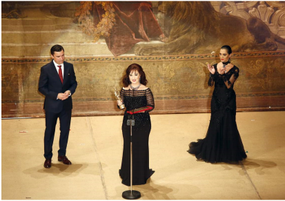
Marele Premiu al Galei: soprana Elena Moșuc