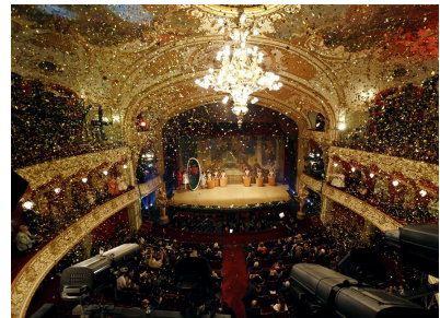
Les Fleurs printre confetii