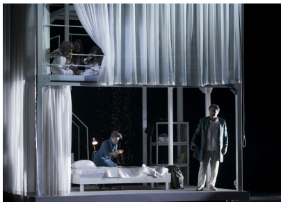
Scenă din actul secund