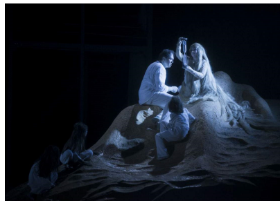
Oedipe și Sfinxul