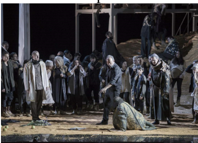
Scenă din actul al III-lea