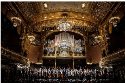
Budapest Festival Orchestra la Academia Franz Liszt

A fost genericul sub care Academia de Muzică Franz Liszt, fondată în 1875, a propus o serată „secretă” ca desfășurare. Chiar așa răspundeau plasatoarele cărora li se solicitau programele de sală, adaugând că le vor distribui la... sfârșit. De pe afiș se știa doar că Budapest Festival Orchestra va fi dirijată de Iván Fischer. Pentru cei care cunoșteau limba maghiară a fost simplu, întrucât șeful de orchestră a prezentat succint piesele. Ceilalți, urmau să le recunoască în măsura în care le erau familiare.