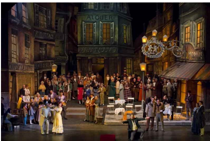
BOEMA, scenă din actul al II-lea

un parc cu arbori seculari și felinare ce filtrează lumina lunii într-o noapte poetică, sub fulgi de nea.