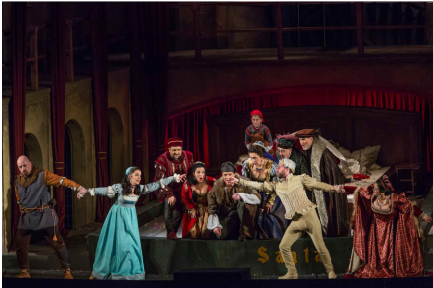
GIANNI SCHICCHI