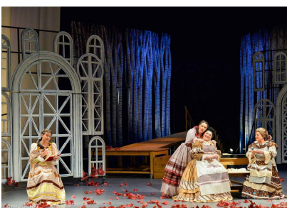
Scenă din primul act

După cum, balul lui Gremin s-a desfășurat într-un spațiu lipsit de fast, între... perdele unicolore. Urmele unor portaluri deteriorate se distingeau în laterală. Timid, una din perdele s-a ridicat pe ultimele acorduri, lăsând să se întrevadă mestecenii de odinioară, spre care Tatiana s-a îndreaptat lent și implacabil, după ce l-a respins pe Oneghin. Un reușit cadraj de final, cu mesaj de reîntoarcere a eroinei în singurătatea de spirit.