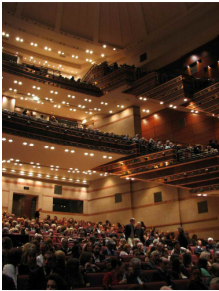
Sala Alexandra Trianti