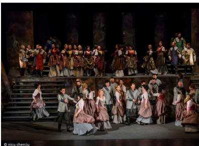
Scenă din primul act