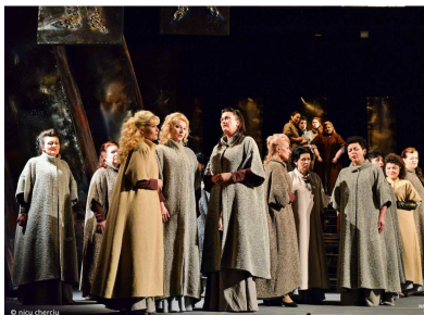
Scenă din actul al doilea