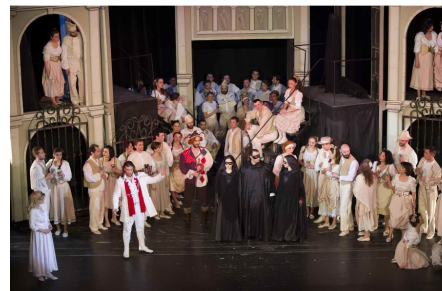
Scenă din primul act