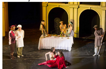
Scenă din actul al doilea