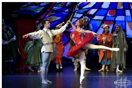
Harap Alb și fata lui Roș Impărat