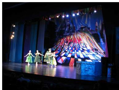
Harap Alb la curtea lui Verde Impărat