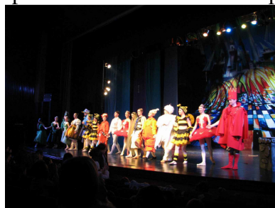
Aplauze pentru HARAP ALB

În privința muzicii, eclecticul colaj a purtat spectatorii pe aripile diverselor stiluri, de la rock la... baroc, de la sonuri Vivaldi – sau Mozart-like la romantice și înapoi la rock.