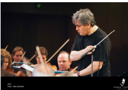
Antonio Pappano