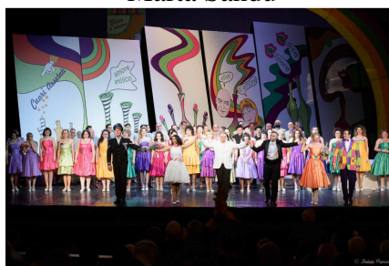
Elixirul dragostei, aplauze la rampa

Tiberiu Soare a condus cu mână sigură, rezolvând operativ izvoarele de decalaj scenă-fosă și a conferit spectacolului temperament, dar și coerență, echilibru. Tempouri bine cumpănite au dat eleganță paginilor cu specific „concertato”.